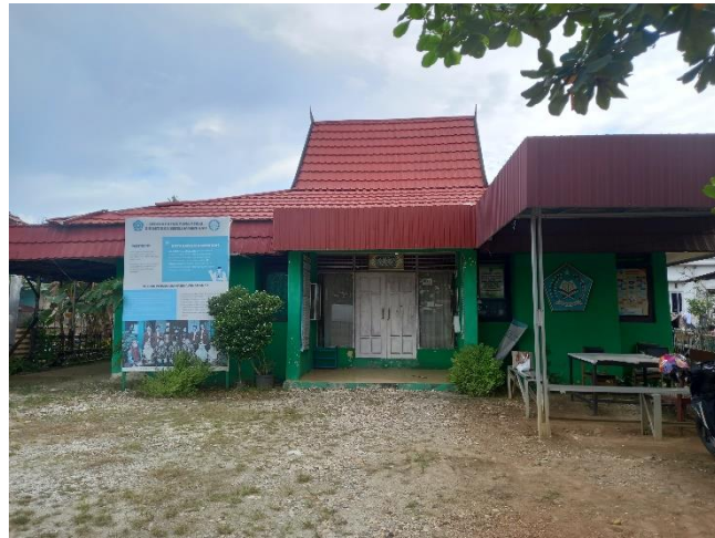
Dokumentasi Depan KUA Kecamatan Gambut