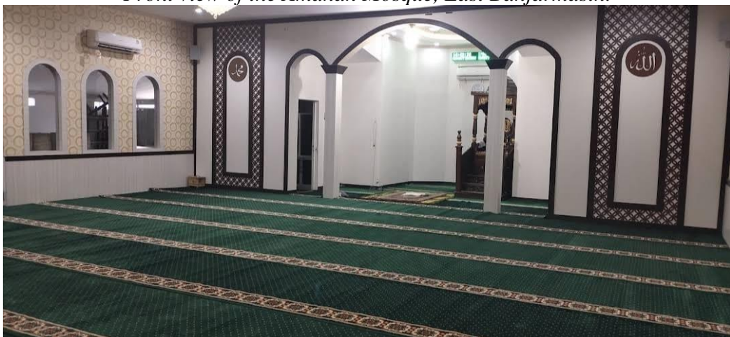
Seen inside the Amanah Mosque, East Banjarmasin