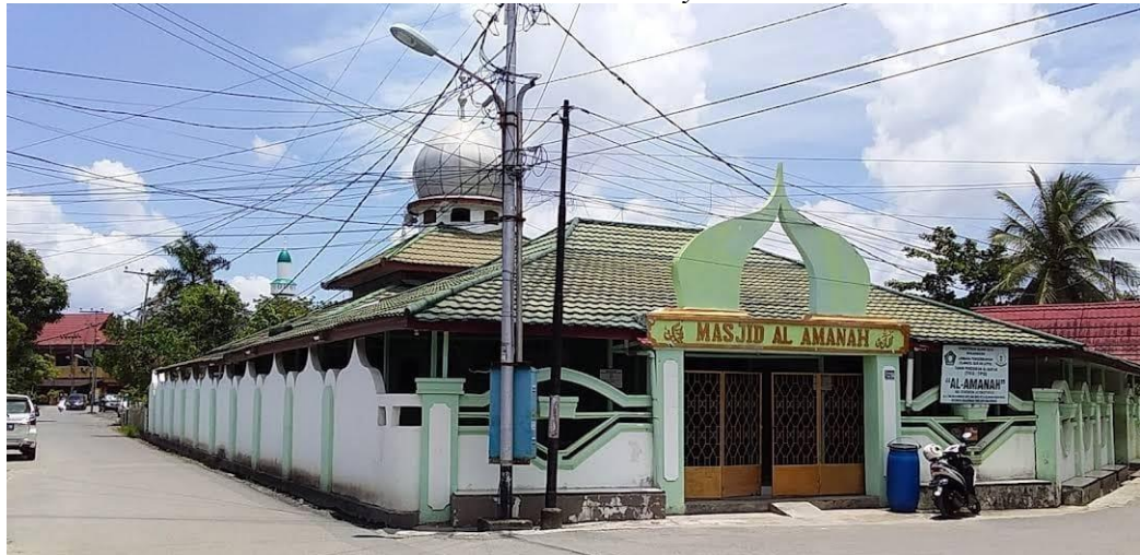
Front view of the Amanah Mosque, East Banjarmasin.