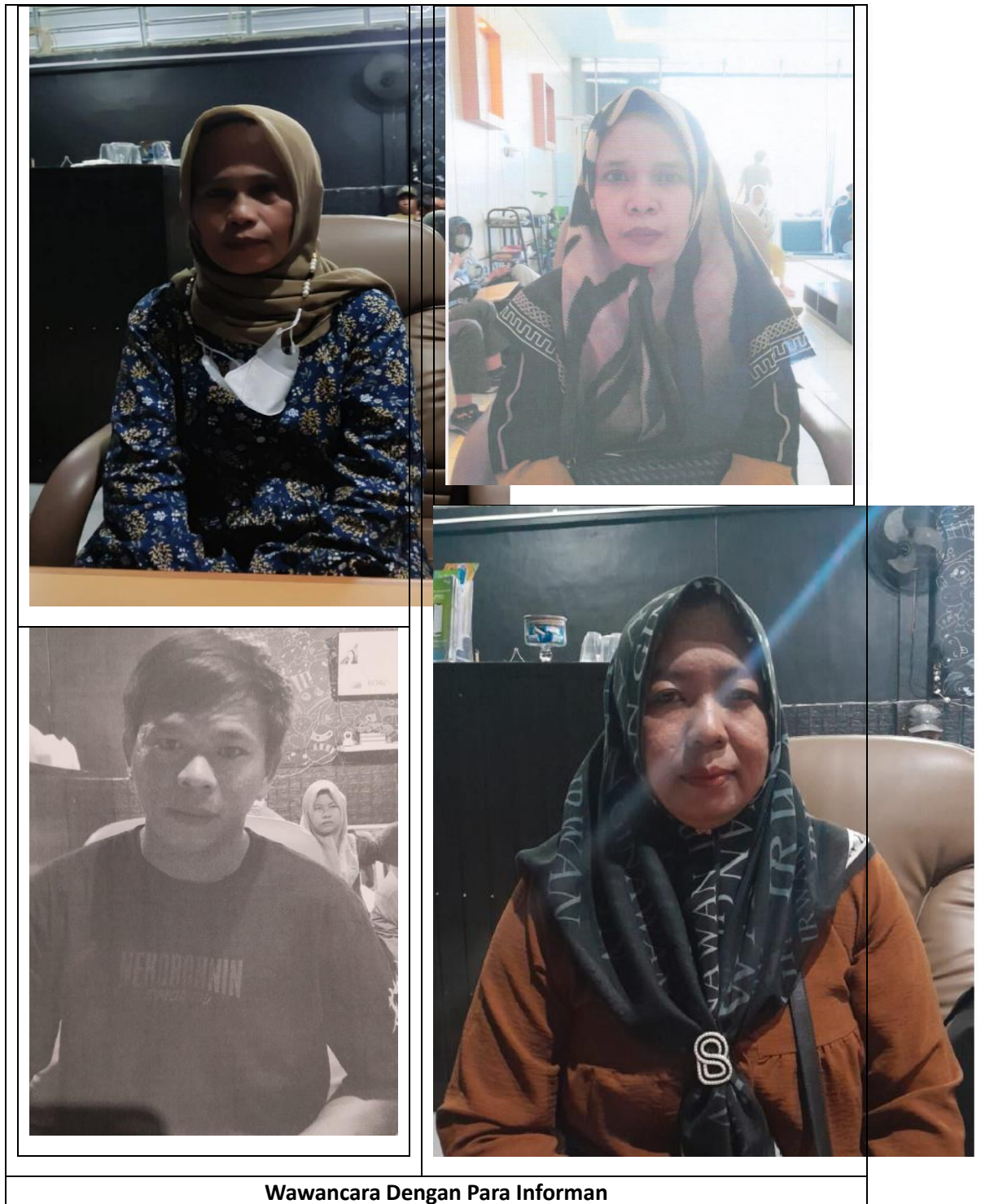
Wawancara Dengan Para Informan