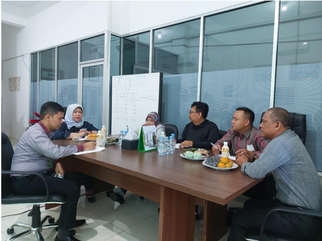
Wawancara Bersama Kepala Cabang dan Para Pejabat Struktural BPJS Ketenagakerjaan Cabang Batulicin

Bersama Pejabat Baru BPJS Ketenagakerjaan Cabang Batulicin