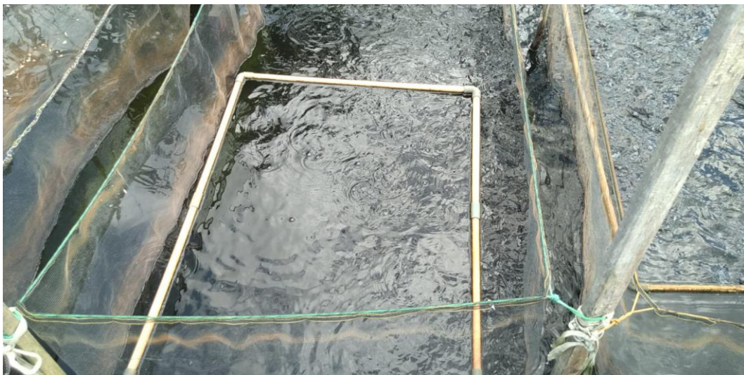
Lampiran 4. Tambak Budidaya ikan lele di Tatah Belayung Kel. Tanjung Pagar Kecamatan Banjarmasin Selatan