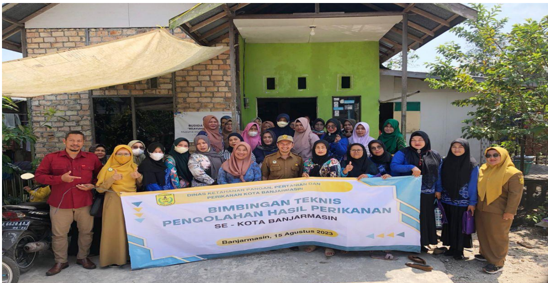
Lampiran 9. Bimbingan Teknis Hasil Perikanan