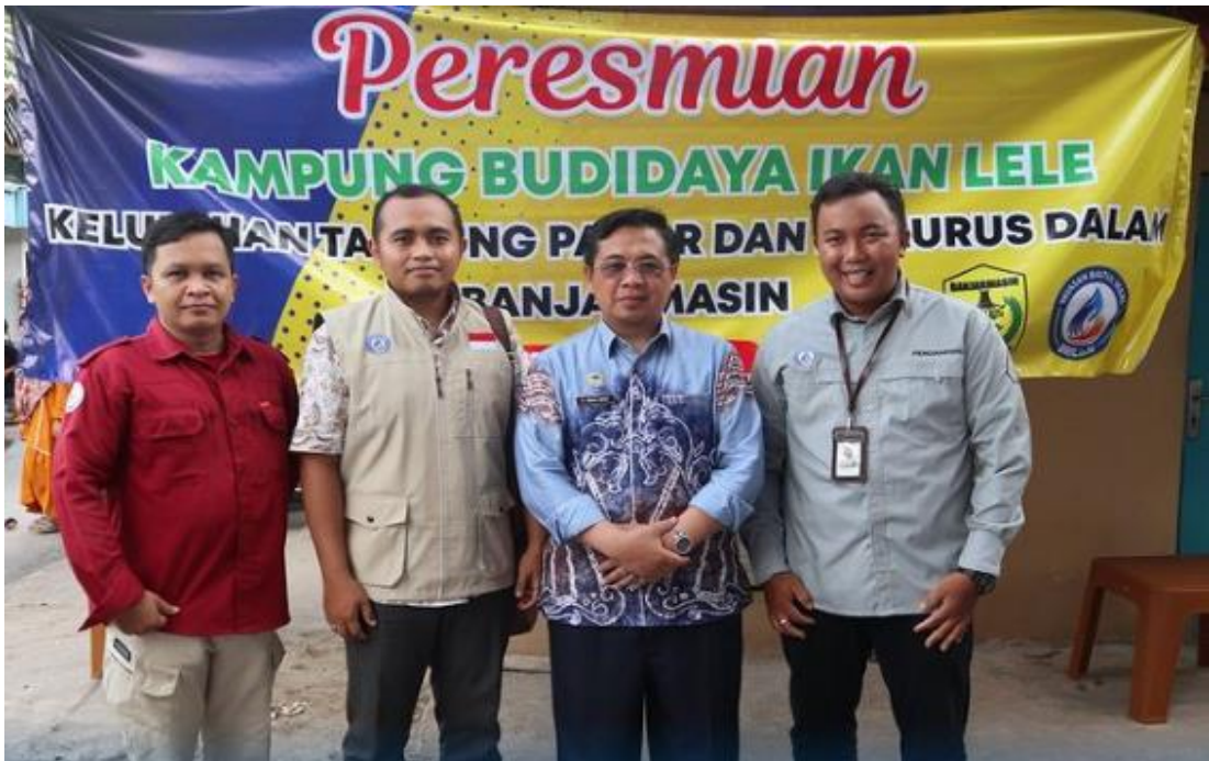
Lampiran 8. Peresmian Kampung Budidaya Ikan Lele