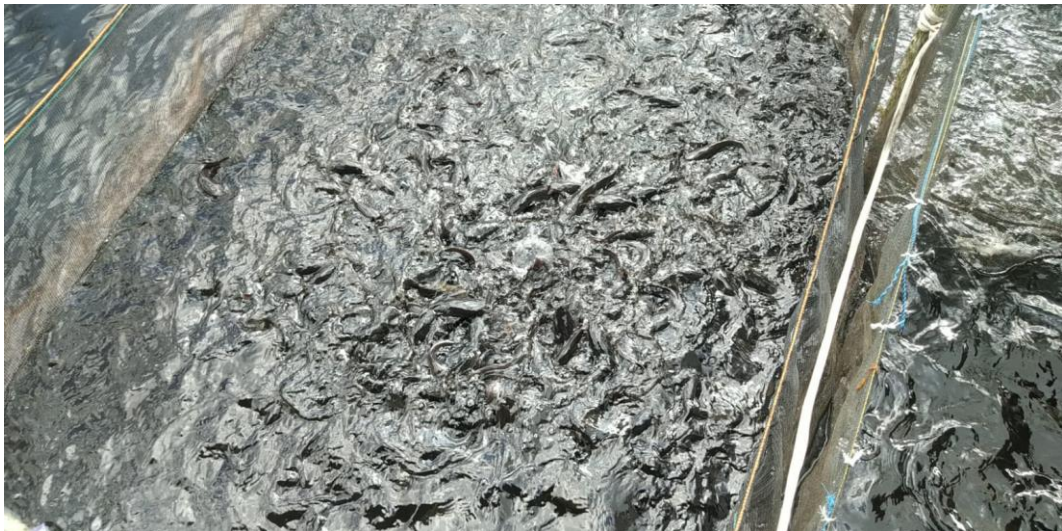
Lampiran 5. Tambak Budidaya ikan lele di Tatak Belayung Kel. Tanjung Pagar Kecamatan Banjarmasin Selatan