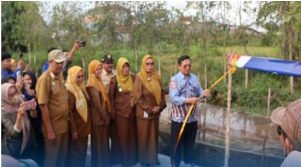
Lampiran 7. Pemberian Bibit Ikan Lele