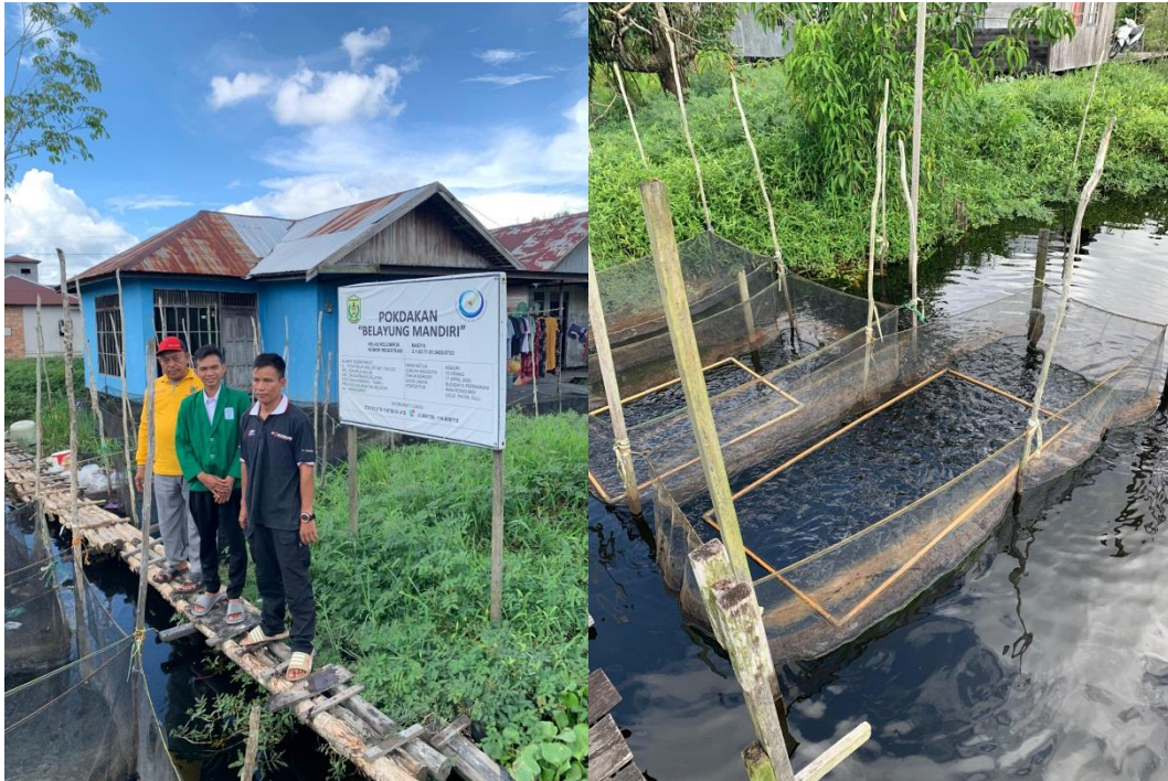
Lampiran 3. Tambak Budidaya ikan lele di Tatah Belayung Kel. Tanjung Pagar Kecamatan Banjarmasin Selatan