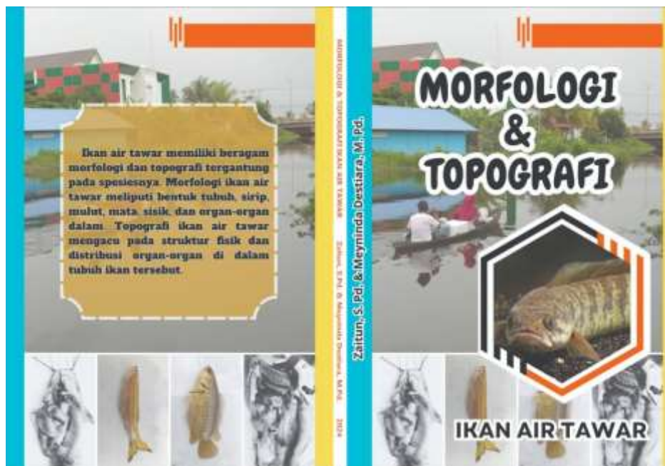
Gambar 15. Sampul Depan dan Belakang Buku Ilmiah Populer

Hasil dari penelitian ini akan dikembangkan menjadi sebuah produk berupa buku ilmiah populer tentang Morfologi dan Topografi Ikan Air Tawar. Adapun cover depan dan belakang buku ilmiah populer ini dapat dilihat seperti pada gambar di bawah ini: