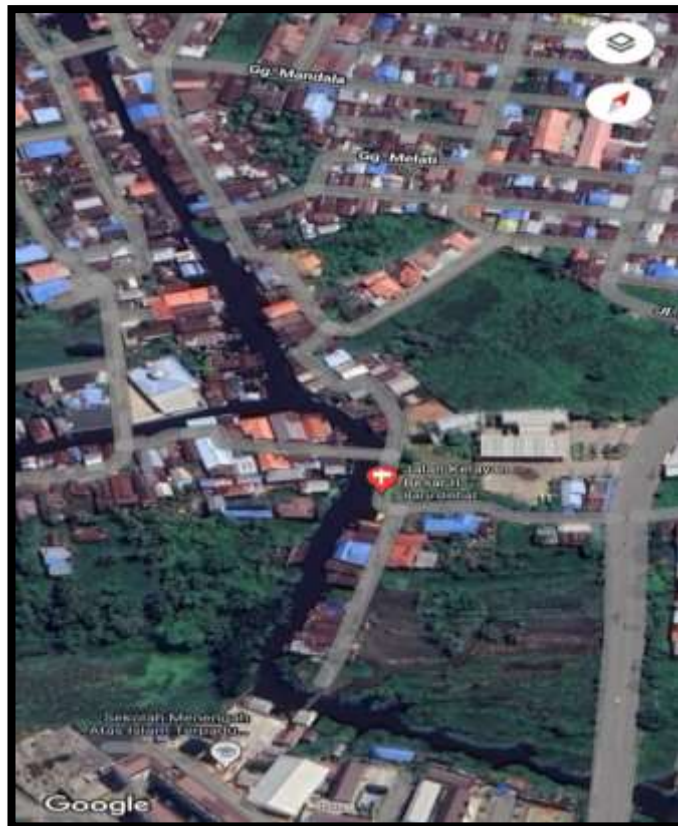
Gambar 16. Kelayan Besar II Kelurahan Pemurus Baru

Penelitian ini dilakukan di Kelayan Besar II Kelurahan Pemurus Baru. Proses penelitian dimulai dari kegiatan penyusunan proposal, seminar proposal, pengolahan data, penyusunan dan validasi buku ilmiah populer, dan penyusunan skripsi. Penelitian ini dilaksanakan pada 10 September 2023 – 30 Agustus 2024.