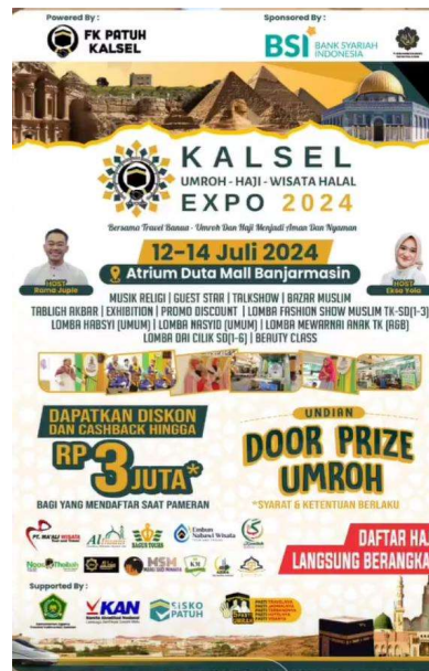
Gambar 4. 5 Dokumentasi saat PT Ma'ali Tour and Travel Banjarmasin berpartisipasi pada Kalsel EXPO 2024

sampai 14 Juli 2024 bertempat di Atrium Utama Duta Mall Banjarmasin. Berikut ini merupakan dokumentasi saat PT Ma'ali Tour and Travel Banjarmasin berpartisipasi pada Kalsel EXPO 2024: