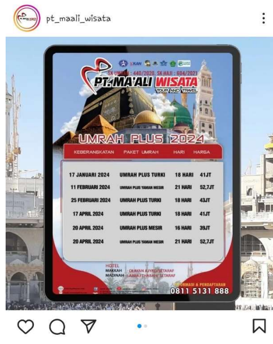
Gambar 4. 2