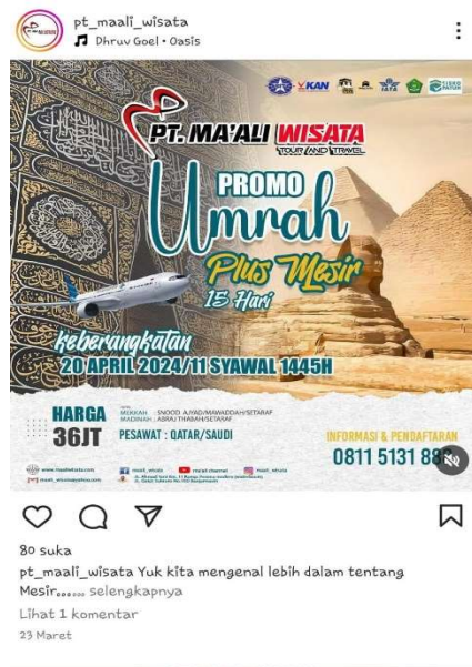
Gambar 4. 3 Contoh Promosi Ma'ali wisata Tour and Travel Banjarmasin melalui Instagram