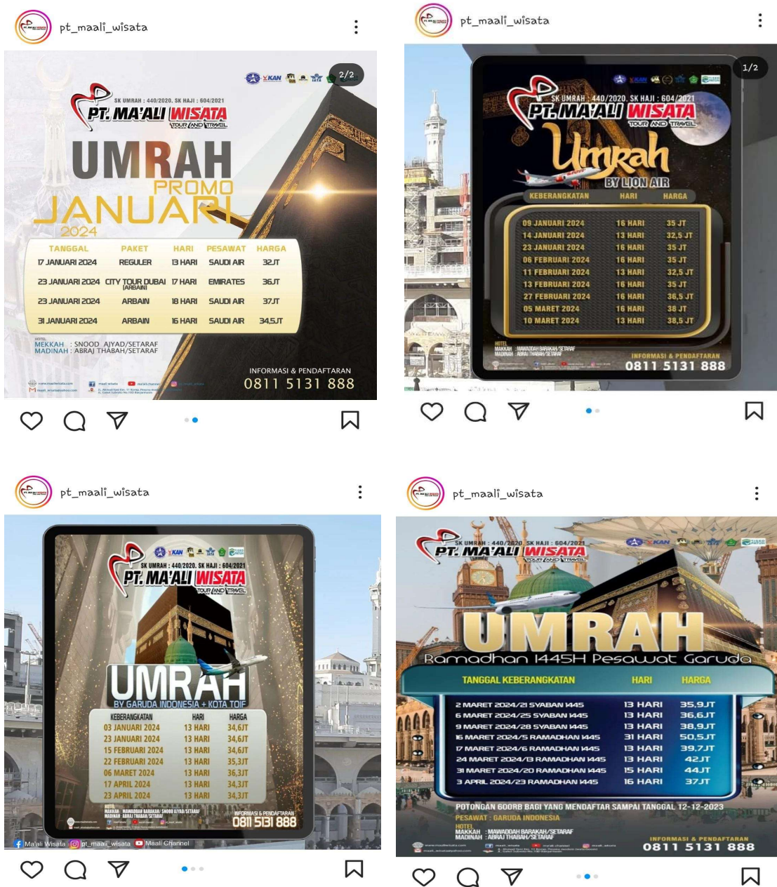
Gambar 4. 1 Harga Produk Umroh PT Ma'ali Wisata Tour And Travel