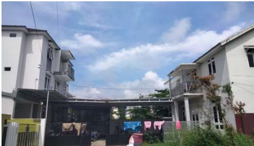
Gambar 3.1 Bangunan Asrama Mahasiswi Tahfidz Husada

Pembangunan awal dari Asrama Tahfidz ini hanya dibangun 1 asrama saja yang terdiri dari 4 lantai, kemudian karena melihat keadaan mahasantriwati yang terus bertambah maka dibangun kembali 1 asrama yang terdiri dari 2 lantai pada tahun yang sama. Adapun sistem pendidikan dari asrama Tahfidz Husada ini memiliki perbedaan dengan asrama pada umumnya yang ada di Pondok Pesantren Salafi yang menekankan pada penguasaan kitab kuning, sedangkan asrama ini lebih menekankan mahasantriwatinya dalam menghafal Al-Qur'an.