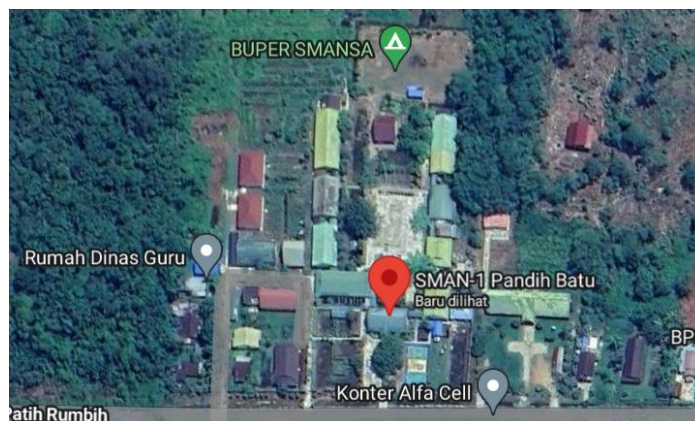
Gambar 3. 2 Letak Geografis SMAN 1 Pandih Batu

Proses penelitian dilaksanakan sejak tanggal 05 Oktober 2022 sebagai studi pendahuluan dan berakhir pada 27 Juni 2024.