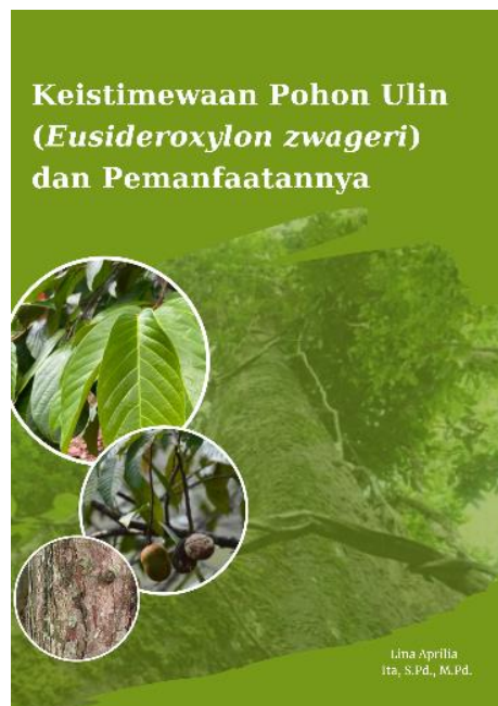
Gambar 2.9. Contoh Cover BIP Hasil Rancangan Peneliti