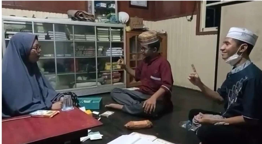
Gambar 4.1 Pembelajaran Al-Qur'an Gerak Isyarat Surah Al-Fâtiḥah

Allah sudah menciptakan bahwa tangan mereka itu sama dengan telinga dan mulutnya. Maka ketika difabel tunarungu belajar Al-Qur'an yang dilihat adalah tangannya yang berfungsi sebagai telinga dan mulutnya. Kalau salah mengisyaratkan gerak tangannya, maka salah pengucapannya. 2