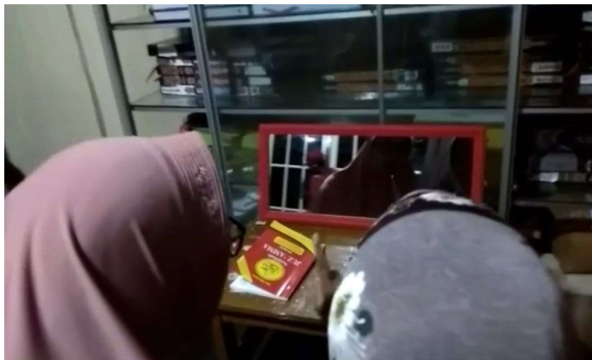
Gambar 4.5 Metode Cermin

Metode isyarat dengan pendekatan terapi wicara melalui getar. Awal-awal caranya di tekan dibagian tenggorokan, jadi mereka tahu hurufnya dengan merasakan getar suara tersebut. Ketika saya mengeluarkan suara huruf Alif, mereka melihat bentuk mulut Ibu dan menirukannya. Fungsi tunarungu dalam hal ini organ tunarungunya ini berbeda dengan kita. Akan tetapi walaupun kondisi tuli total, tulang telinganya bagian dalam itu bisa berfungsi untuk menghantar dan menerima getar bukan suara, disitulah Ibu memasukkan teknik terapi wicara. Selain itu, Ibu juga menggunakan metode cermin yaitu dengan mendekatkan cermin di muka bibir sehingga mengetahui bentuk mulutnya dan untuk mengetahui mengeluarkan nafas atau tidak Ibu menggunakan lilin. Hal tersebut dilakukan untuk mengetahui makhrajnya benar atau tidak per-hurufnya. 11