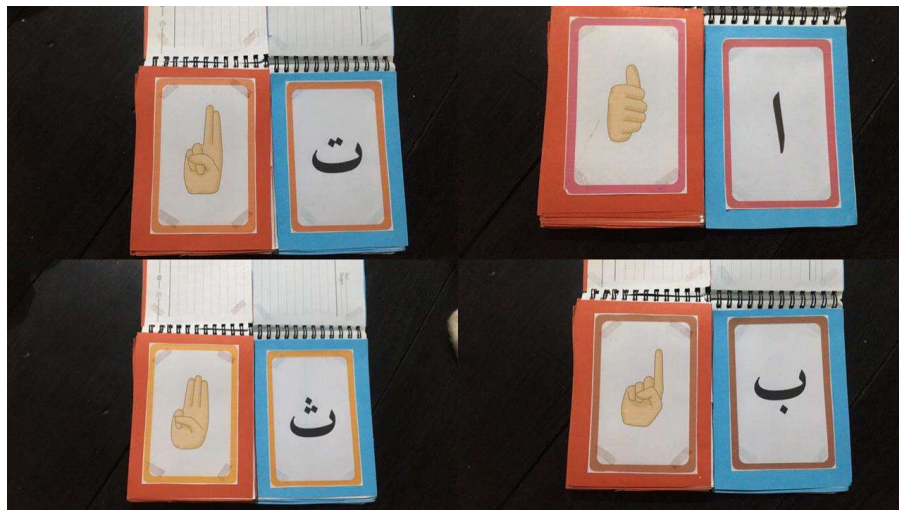
Gambar 4.6 Kartu Isyarat

Teknis penggunaan kartu isyarat kurang lebih sama penggunaannya seperti kertas isyarat yang dibuat manual oleh pembimbing. Akan tetapi ada sedikit perbedaan diantara keduanya yaitu kertas isyarat hanya berisikan kosa kata ataupun huruf hijâiyah yang bergambar gerakan isyarat yang tergabung menjadi satu. Sedangkan kartu isyarat berbentuk seperti kartu yang terpisah-pisah antara kosa