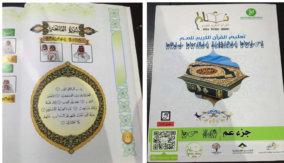
Gambar 4.7 Buku Ta'lim al-Qur'an al-Karîm li Shummi

Pelaksanaan pembelajaran Al-Qur'an isyarat Surah Al-Fâtiḥah juga menggunakan media berupa buku Juz 'Ammah Bahasa Isyarat. Dalam pelaksanaannya, pembimbing memberikan contoh pada setiap ayat dengan gerak isyarat dan diikuti oleh difabelitas rungu wicara di Rumah Belajar Kita. Berikut buku yang digunakan dalam proses pembelajaran.