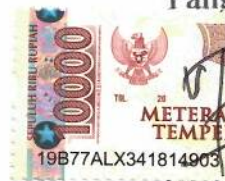
Muhammad Faidh Madadi

Banjarmasin, 7 Oktober 2024 Yang membuat pernyataan,