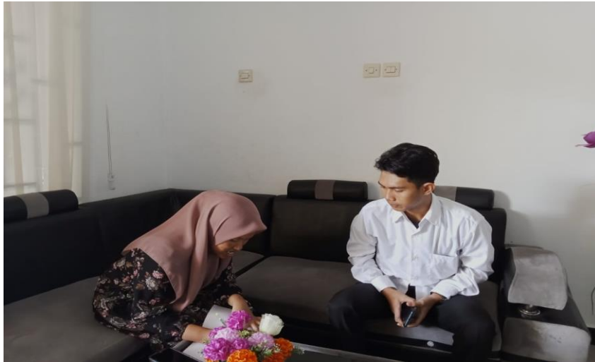
Gambar 1.5 Wawancara dengan Pustakawan Bidang Pengolahan