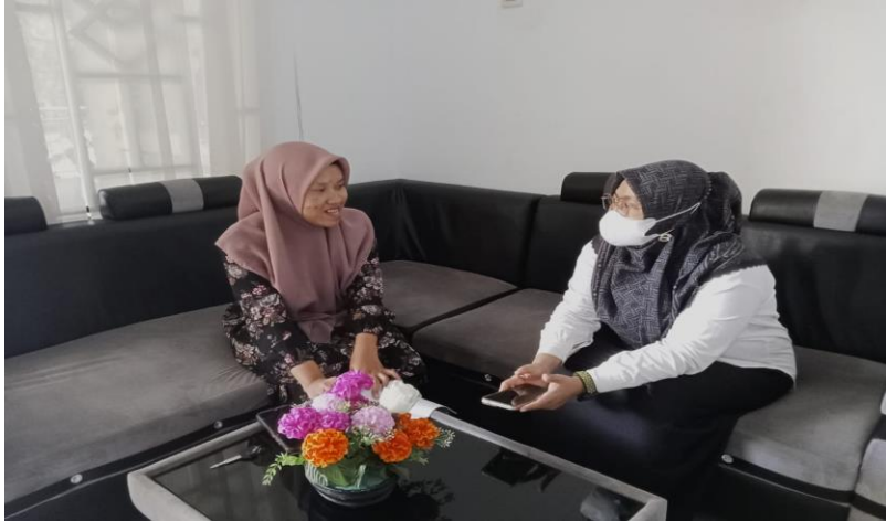
Gambar 1.3 Wawancara dengan Pustakawan Bidang Sirkulasi