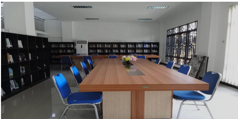
Gambar 1.6 Observasi Ruang Baca para Pemustaka