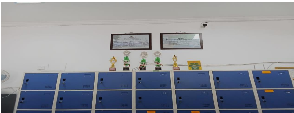
Gambar 1.9 Observasi Loker Penyimpanan Arsip