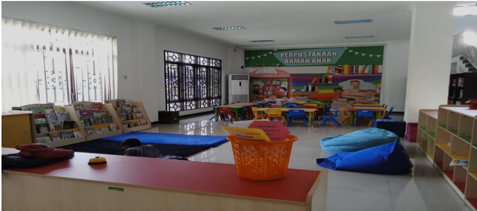
Gambar 1.7 Observasi Ruang Baca Perpustakaan Anak