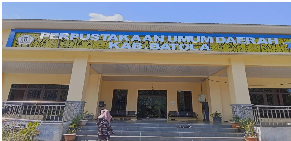
Gambar 1.8 Observasi Tampak Depan Perpustakaan Umum Daerah Kabupaten Barito Kuala