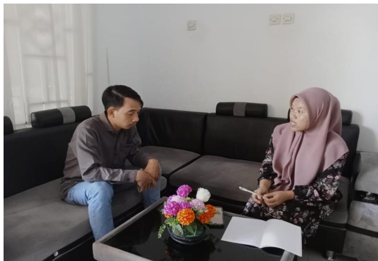
Gambar 1.2 Wawancara dengan Pustakawan Bidang Pelayanan