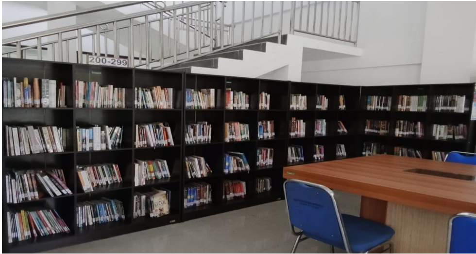
Gambar 2.0 Observasi Koleksi Buku daeri Klasifikasi 200-299