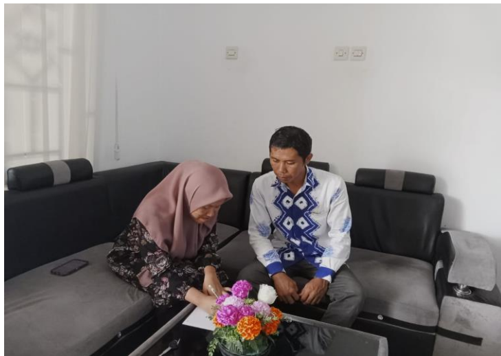
Gambar 1.1 Wawancara dengan Pustakawan Bidang Pengolahan