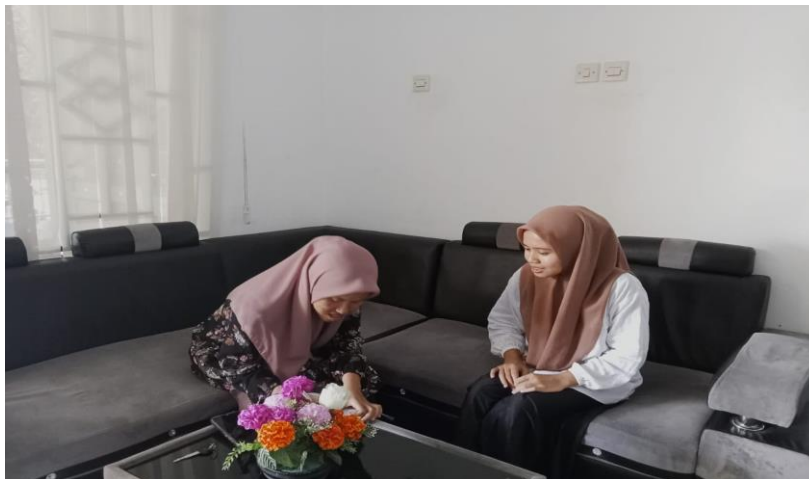
Gambar 1.4 Wawancara dengan Pustakawan Bidang Referensi