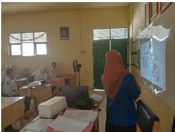
Gambar 4.6 Evaluasi

Fase 6 Guru memberikan penjelasan ulang mengenai materi dan guru membenarkan jika ada pemahaman yang salah. Dan diberi kesimpulan bersama. Dari guru dan siswa.