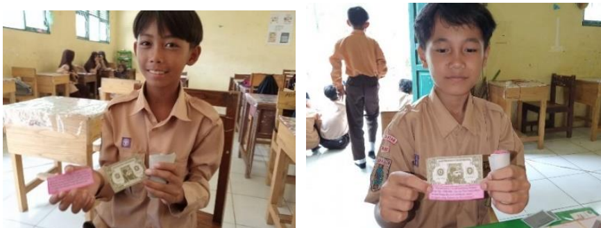
Gambar 4.17 siswa benar menjawab pada kartu kesempatan