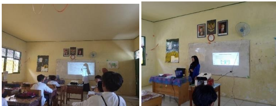
Gambar 4.14 penyampaian materi dan soal untuk siswa menjawab kedepan