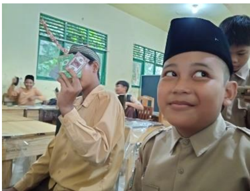
Gambar 4.11 menerima uang dari bank