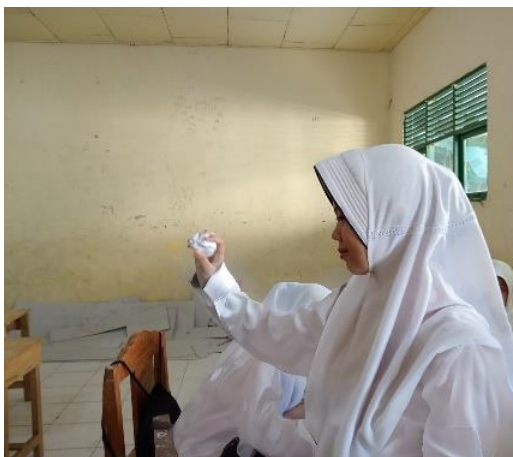
Gambar 4.4 Pelemparan bola kertas

Fase 4 Kemudian kertas pertanyaan di buat seperti bola lalu lemparkan dari satu siswa ke siswa yang lain. Setelah siswa telah mendapatkan bola pertanyaan.