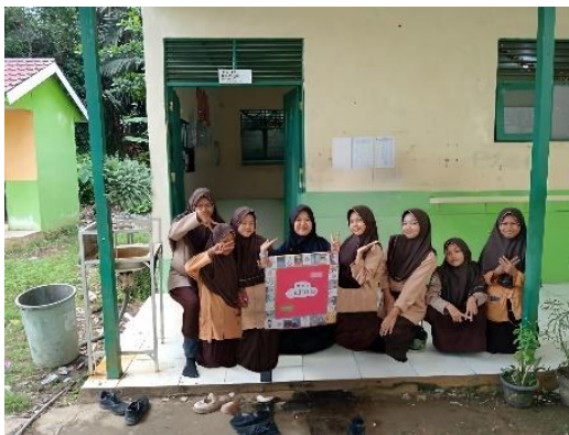
Gambar 4.13 kelompok 1 yang menang

Sehingga jika di total kelompok 1 yang memiliki rumah terbanyak dan uang terbanyak, sehingga pada kelas kontrol kelompok 1 yang memenangkan permainan.