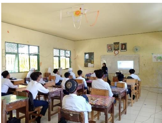
Gambar 4.15 penutup

Guru memberikan motivasi kepada siswa untuk selalu belajar dirumah dan menyampaikan pertemuan selanjutnya akan bermain monopoli aritmatika, selanjutnya guru mengajak siswa menutup pembelajaran dengan mengucapkan hamdallah, dan terakhir guru mengucapkan salam.