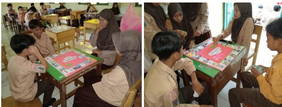
Gambar 4.16 pergantian pemain