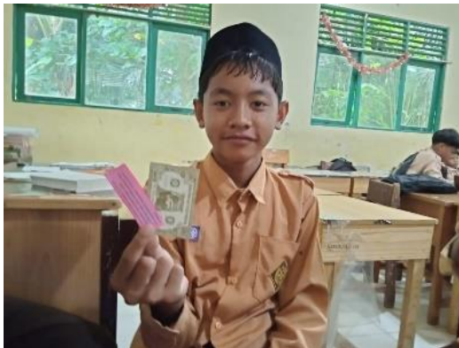
Gambar 4.12 siswa menjawab benar pada kartu kesempatan mendapatkan bonus dari bank