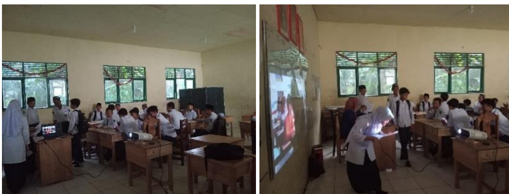
Gambar 4.2 Pembentukan kelompok & Pengarahan

Fase 2 guru menjelaskan mengenai prosedur pelaksanaan snowball throwing Selanjutnya, memberikan arahan untuk melakukan pembentukan kelompok dari 1-4 dan setelah di bentuknya kelompok siswa dapat menentukan sendiri perwakilan kelompok untuk maju ke depan. kemudian guru menunjuk masing-masing perwakilan anggota kelompok untuk maju ke depan. disini guru mengarahkan atau menjelaskan kepada ketua kelompok mengenai materi yang akan dipelajari yaitu mengenai aritmatika sosial terkait keuntungan kerugian dan mereka akan menjelaskan kembali kepada teman sekelompoknya.