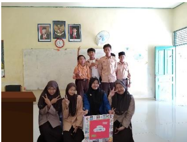
Gambar 4.18 kelompok 3 menang

Sehingga jika di total kelompok 3 yang memiliki rumah terbanyak dan uang terbanyak, sehingga pada kelas kontrol kelompok 3 yang memenangkan permainan.