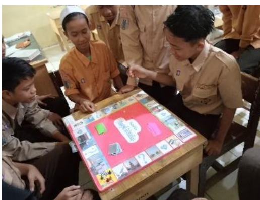
Gambar 4.9 mencari pemain yang pertama bermain

Sesuai dengan kesepakatan kelompok yang mendapatkan jumlah mata dadu pertama akan main terlebih dahulu.