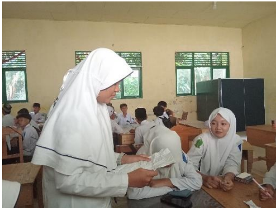
Gambar 4.5 membaca soal dan jawaban

Fase 5 lalu guru memberikan kesempatan kepada siswa untuk menjawab pertanyaan kurang lebih 10 menit yang ditulis dalam kertas yang berbentuk bola tersebut. Kemudian perwakilan dari kelompok membacakan soal dan jawaban yang telah kelompok mereka jawab.