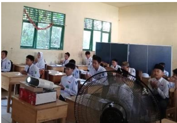
Gambar 4.1 kegiatan awal pembelajaran

Guru memulai pembelajaran dengan mengucapkan salam, mengarahkan siswa untuk berdo'a dan mengecek kehadiran siswa. Kemudian guru menyampaikan bab yang akan di pelajari pada pertemuan kali ini sereta menyampaikan tujuan pembelajaran yang akan dilaksanakan.