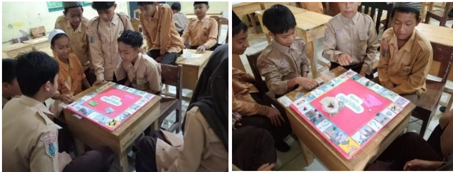
Gambar 4.10 pergantian pemain