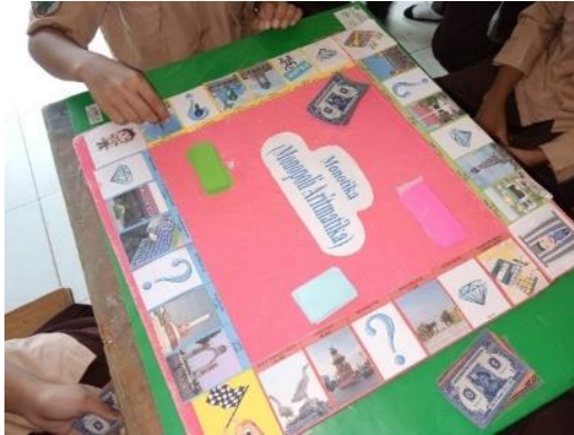
Gambar 4.8 permainan dimulai

a) Setiap perwakilan kelompok melempar dadu secara bergantian.