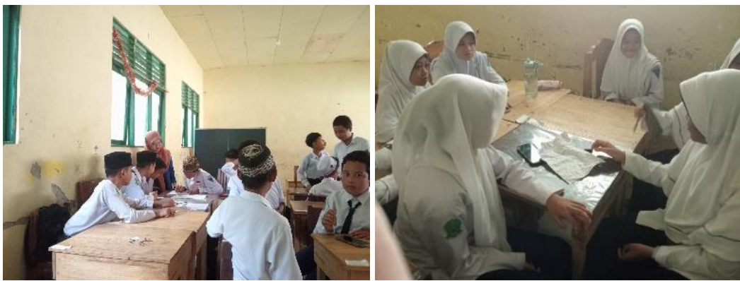
Gambar 4.3 Menjelaskan dan membuat soal terkait materi

terhadap anggotanya masing masing (berdiskusi). Diberi waktu kurang lebih 60 menit .disini guru harus terus memantau siswa apakah penjelasan dari ketua kelas sudah benar dan teman-teman nya sudah paham terhadap materi yang disampaikan. Kemudian masing masing diberikan lembar kerja (kertas kosong) untuk membuat pertanyaan apa yang menyangkut dari materi tersebut dan disertai jawabannya, namun jawaban ditulis di kertas yang berbeda.