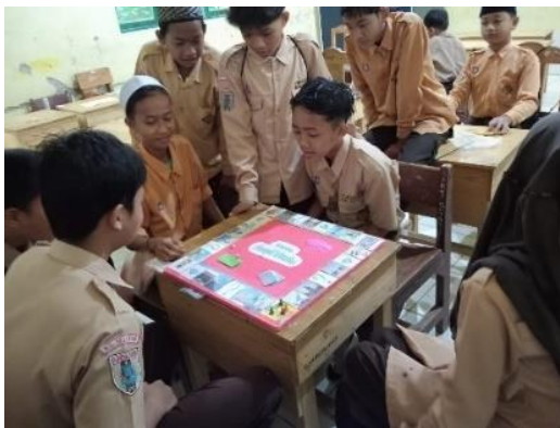
Gambar 4.7 bermain monopoli

Sebelum permainan di mulai guru menyampaikan tata cara bermain monopoli matematika kepada siswa yang belum paham cara bermainnya. Masih dengan kelompok kemarin, guru menyampaikan bahwa masing-masing kelompok harus menunjuk salah satu anggotanya untuk bermain di putaran pertama, ketika putaran pertama berakhir, siswa harus menunjuk orang berikutnya untuk bermain diputaran kedua, dan seterusnya sampai semua anggota kelompok berpartisipasi dalam permainan monopoli aritmatika.