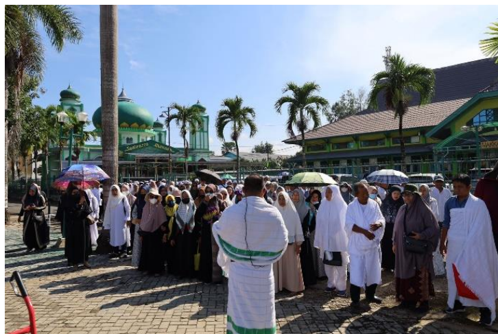
Gambar 4- 3 Mandala Praktik Langsung Tahun 2023

Tema Mandala tahun 2023 adalah Ramah Lansia yang merupakan tema haji pada tahun itu. Hal ini dibuktikan dari rata – rata usia yang mengikuti Mandala pada tahun 2023 yaitu dari usia 25 tahun hingga 60 tahun dan kegiatan ini dominan diikuti oleh Ibu – ibu.