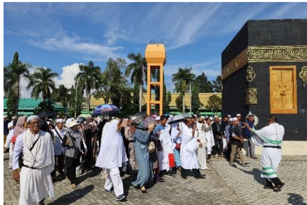
Gambar 4- 6 praktik langsung pada kegiatan Mandala Tahun 2023

Registrasi selesai dilakukan oleh panitia, penyampaian materi dibuka dan diberikan oleh pembimbing Mandala di mesjid Unit Pelaksana Teknis Asrama Haji Embarkasi Banjarmasin. Materi yang disampaikan beragam sesuai dengan pertemuan. Pertemuan pertama pembimbing Mandala menyampaikan terkait persiapan haji, pertemuan kedua menyampaikan terkait umrah, dan pertemuan ketiga pembimbing menyampaikan terkait haji. Selesai penyampaian teori di mesjid Asrama Haji, agenda kegiatan berlanjut dengan melaksanakan praktik langsung di lapangan Asrama Haji Embarkasi Banjarmasin.