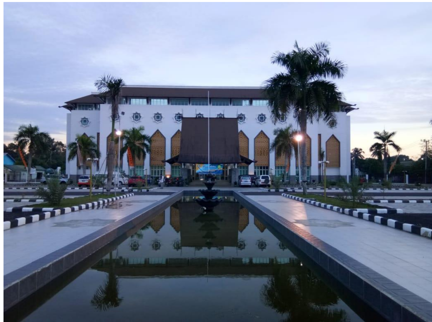
Gambar 4-1 Unit Pelaksana Teknis Asrama Haji Embarkasi Banjarmasin

Asrama Haji Embarkasi Banjarmasin merupakan fasilitas akomodasi yang disediakan untuk jamaah haji, praktik ibadah haji serta pelayanan untuk masyarakat. Asrama Haji Embarkasi Banjarmasin yang berlokasi di Jalan A. Yani KM. 28 Landasan Ulin Banjarbaru didirikan pada tanggal 21 November 1984 dengan luas tanah 73.230 M 2 , dipimpin oleh Bapak H. A. Dachlan yang pada saat itu menjabat sebagai Pjs Kepala Kantor Wilayah Departemen