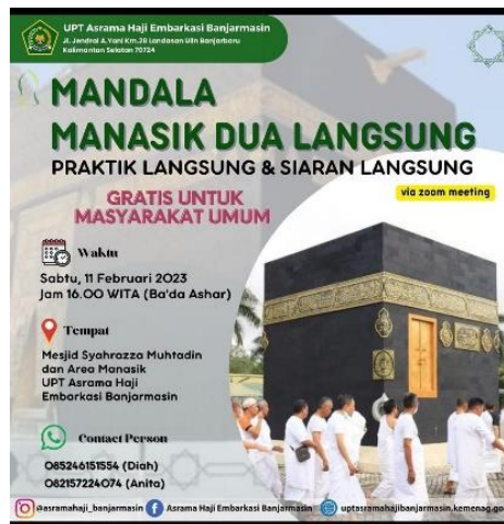
Gambar 4- 2 Brosur Mandala

Metode pembelajaran pada manasik haji yang Bapak H. Haris Fadilah, M. HI inovasikan ialah melalui pemberian materi mengenai seputar Haji dan Umrah. Dua media yang beliau gunakan dalam penyampaian materinya kepada peserta kegiatan, yaitu media online dan offline . Dengan dua media ini beliau dan segenap panitia kegiatan Mandala mengharapkan bahwa kegiatan ini dapat membantu serta memudahkan peserta kegiatan Mandala.