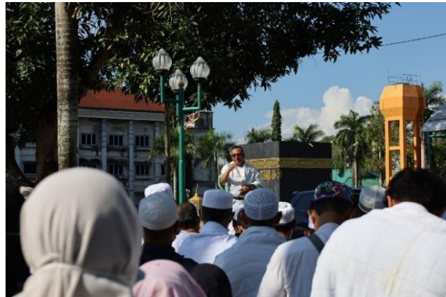
Gambar 4- 5 kegiatan Mandala Secara tatap muka di UPT. Asrama Haji Embarkasi Banjarmasin

muka diharapkan dapat membantu peserta agar memiliki gambaran jelas mengenai haji dan umrah, sehingga pandangan peserta tidak lagi abstrak ketika akan melakukan ibadah ke tanah suci.