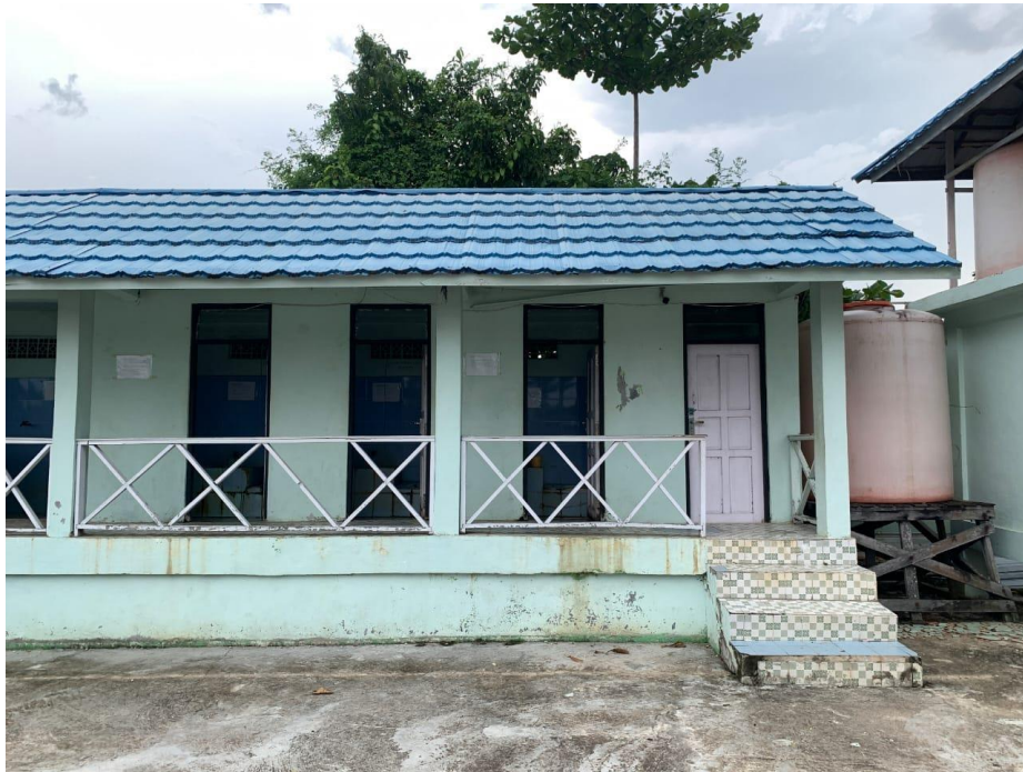
Al-Qur'an dan buku-buku Masjid Nurul Ulum