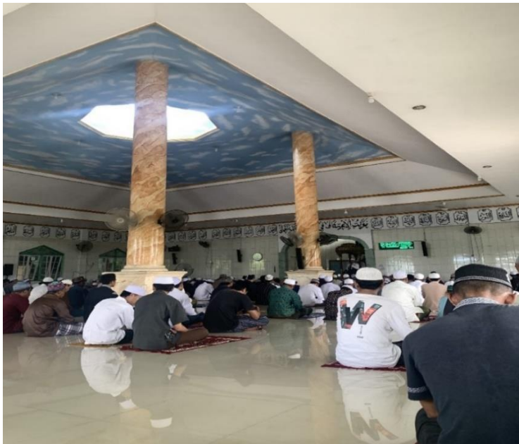
Gambar 4.8 Sholat Jum'at di Masjid Nurul Ulum Desa Pulau Alalak