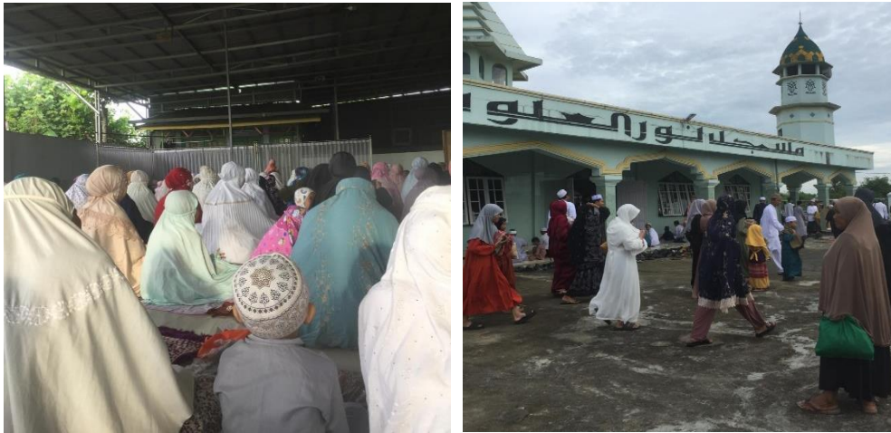
Gambar 4.9 Sholat hari raya idul fitri dan hari raya idul adha di Masjid Nurul Ulum Desa Pulau Alalak