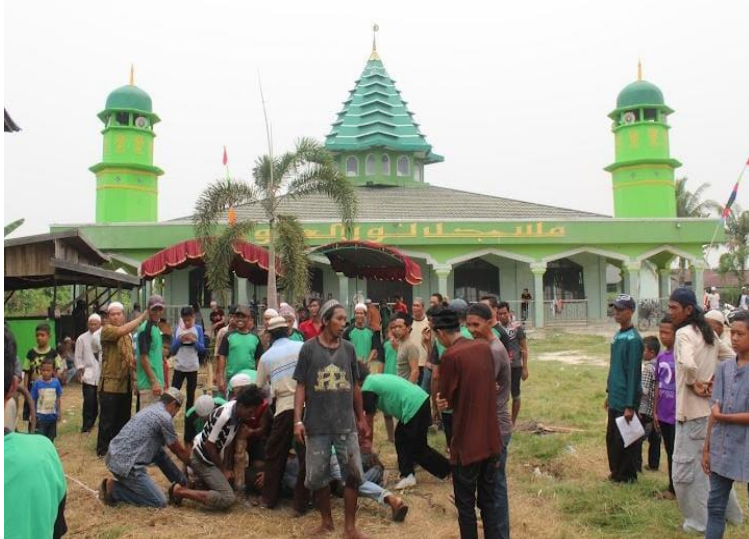
Gambar 4.10 Pemotongan hewan kurban di Masjid Nurul Ulum Desa Pulau Alalak

di korbankan hanya 1 ekor sapi saja karena dana yang kurang cukup di bandingkan tahun sebelum-sebelumnya. Dana yang di dapat yaitu dari hasil sumbangan yang diberi oleh masyarakat sekitar Pulau Alalak dan digabungkan dengan uang kas masjid.