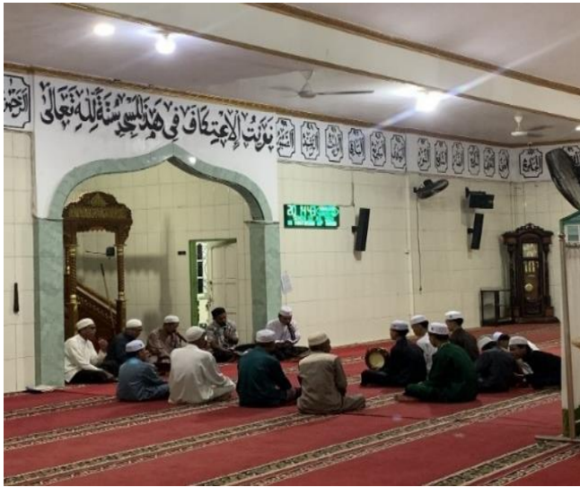
Gambar 4.6 Maulid rutin di Masjid Nurul Ulum Desa Pulau Alalak