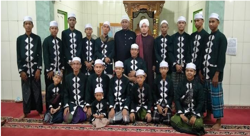
Gambar 4.11 Peringatan hari besar islam di Masjid Nurul Ulum Desa Pulau Alalak

Dari hasil observasi di Masjid Nurul Ulum Pulau Alalak memperingati hari besar islam seperti hari maulid nabi, isra mi'raj, dan tahun baru islam di adakan setiap tahunnya satu kali. Namun untuk maulid rutinannya biasanya di adakan setiap malam selasa setelah sholat isya.