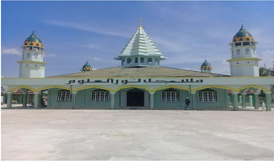
Gambar 4.2 Masjid Nurul Ulum Desa Pulau Alalak