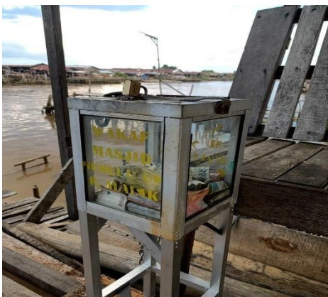
Gambar 4.13 kotak amal masjid Nurul Ulum Desa Pulau Alalak