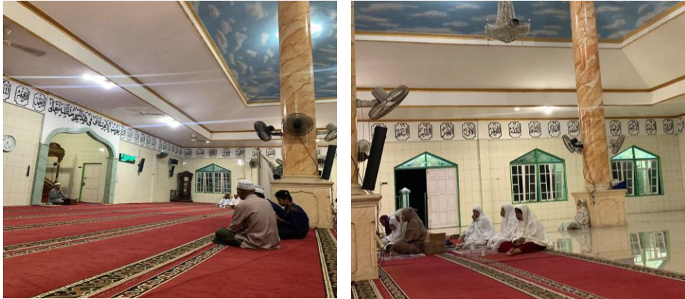
Gambar 4.5 kegiatan keagamaan Majelis ta'lim Masjid Nurul Ulum Desa Pulau Alalak untuk jemaah laki-laki dan perempuan