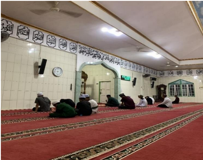
Gambar 4.4 Sholat berjamaah di Masjid Nurul Ulum Desa Pulau Alalak