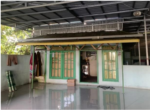
Gambar 4.3 rumah kaum Masjid Nurul Ulum Desa Pulau Alalak