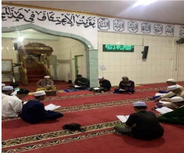
Gambar 4.7 Pembacaan Burdah di Masjid Nurul Ulum Desa Pulau Alalak

burdah di mulai dari sholat magrib berjamaah dan dilanjutkan sholat hajat kemudian pembacaan burdah tersebut di mulai pukul 20:00 wita sampai pukul 22:00 wita. Dalam acara burdah tersebut yang berperan sangat aktif adalah jemaah kaum anak laki-laki yang masih muda.