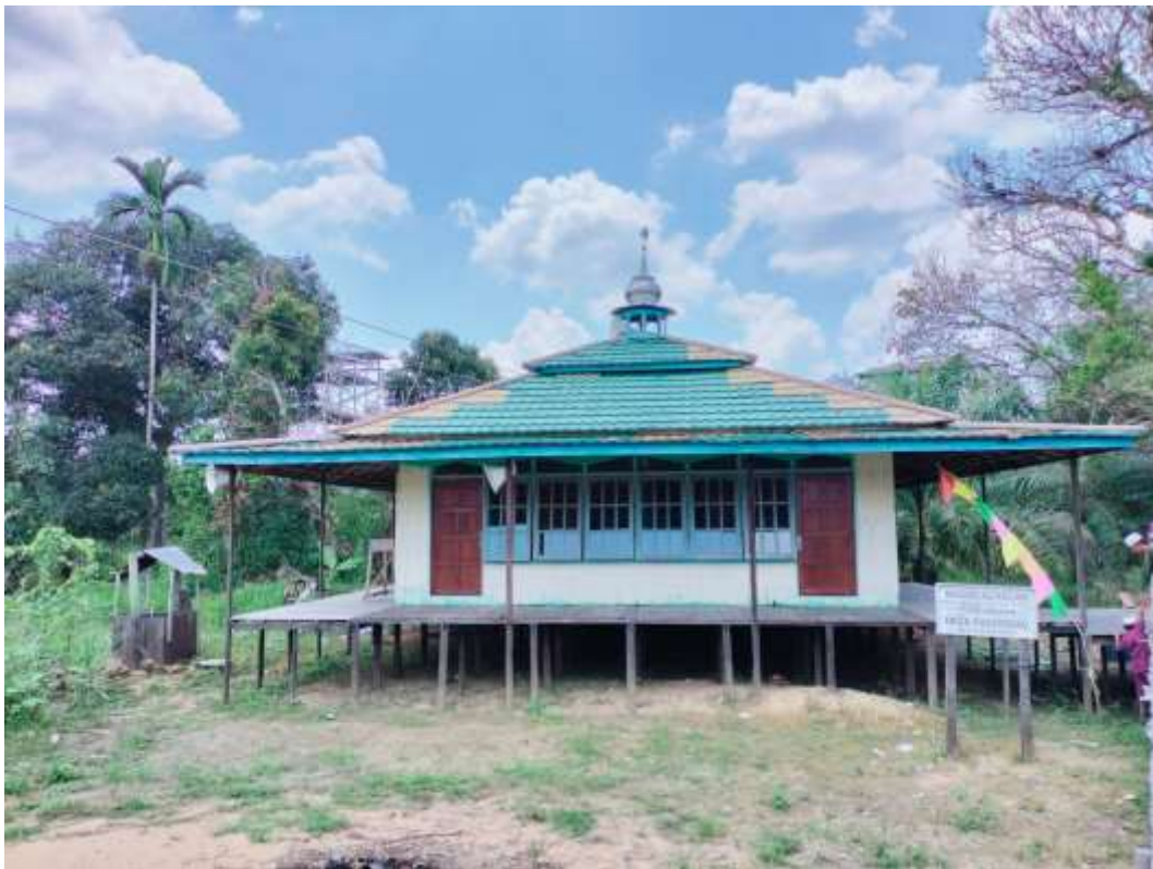
Gambar 1 Bagian Depan Masjid Al-falah Palingkau