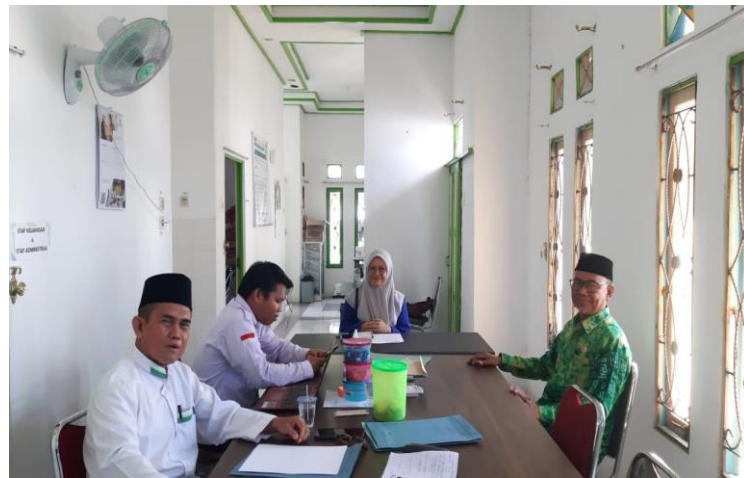
Wawancara dengan pihak BAZNAS Kabupaten Barito Kuala