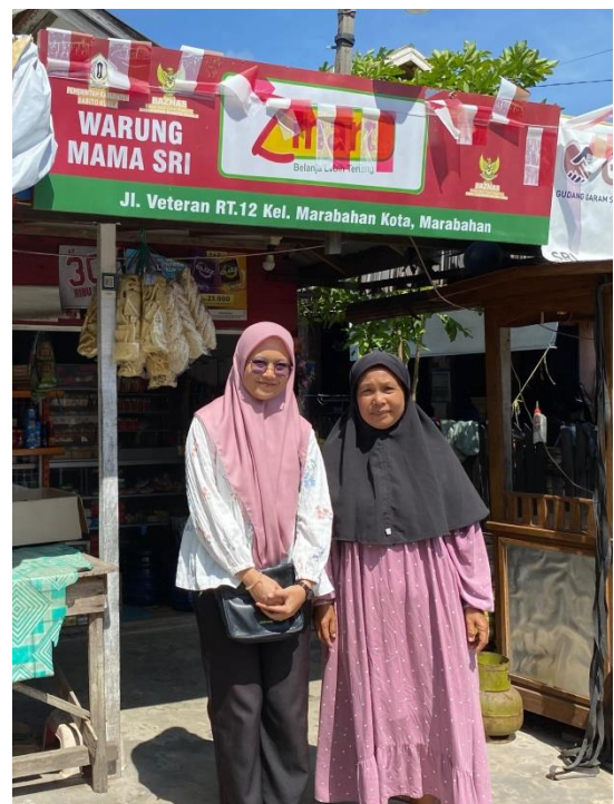
Wawancara dengan penerima program Z-Mart