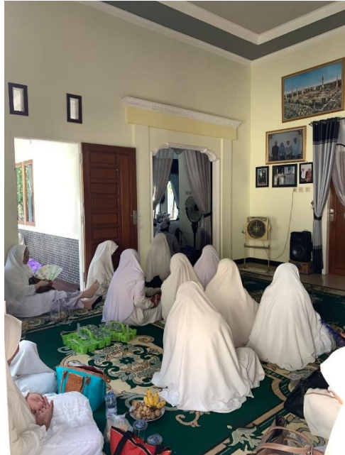
Dokumentasi Ketika Menghadiri Majelis Taklim Yang Ada Di Tabalong