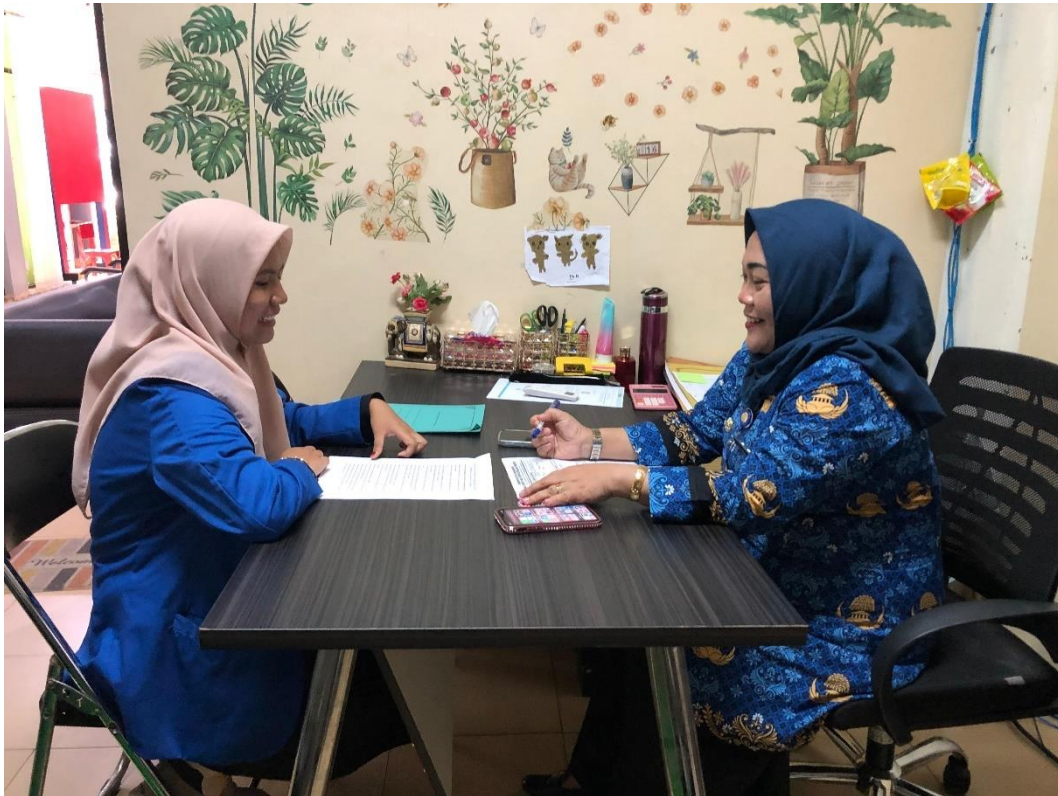
Gambar 3 Kegiatan Wawancara