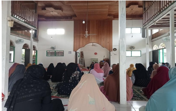
Suasana Ceramah ibu-ibu-Senin, 26 Agustus 2024