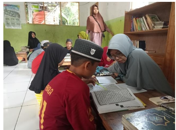
Suasana pengajian anak-anak TPA Nurul Iman-Senin, 12 Agustus 2024