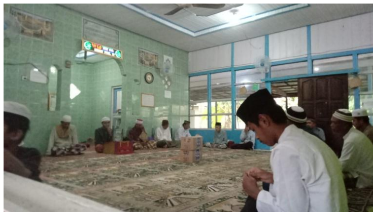
Suasana pengajian ceramah agama di Desa Pandawan, 23 Juli 2024