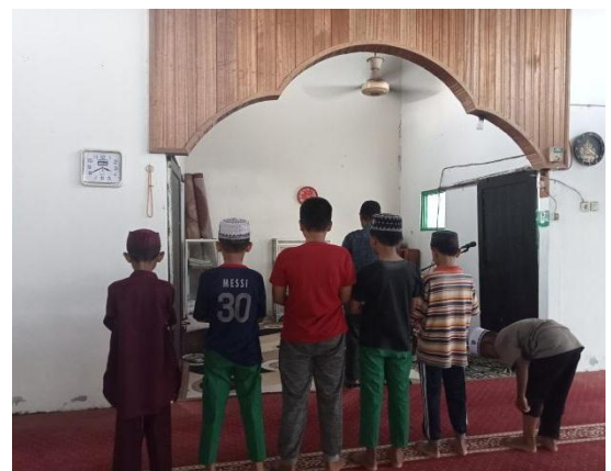
Dokumentasi berwudhu dan sholat asar anak laki-laki sebelum mengaji Al-Qur'an