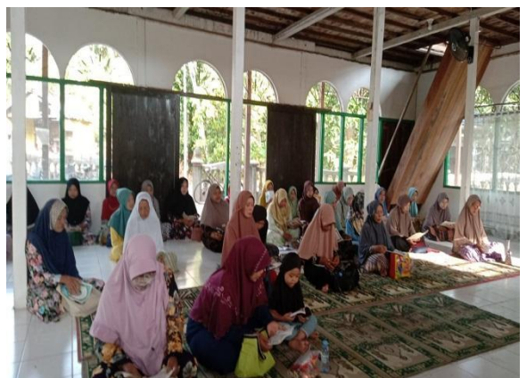
Suasana ceramah ibu-ibu-Senin, 12 Agustus 2024