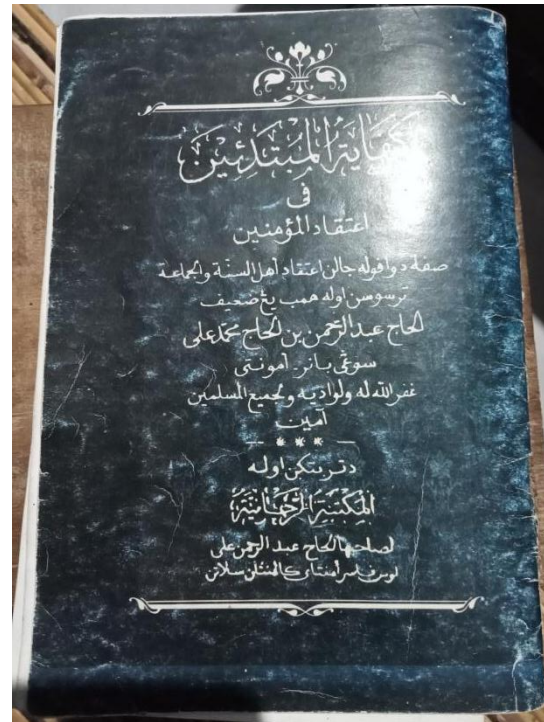
Kitab-kitab yang digunakan untuk pengajian kitab tauhid Desa Pandawan