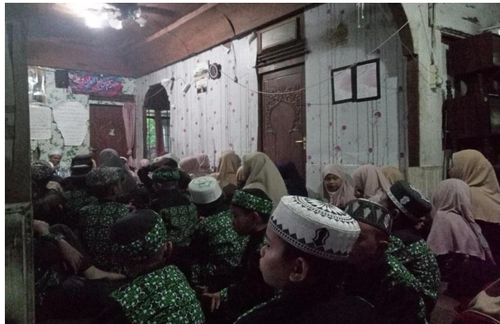
Suasana bimbingan tahfidz Al-Qur'an-Rabu, 14 Agustus 2024