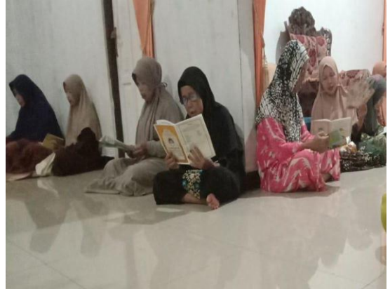
Suasana Majelis Sholawat Ibu-Ibu-Selasa, 16 Agustus 2024