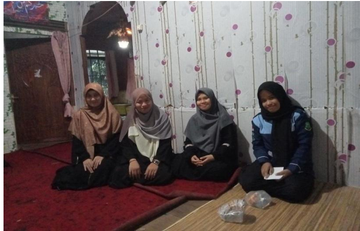
Dokumentasi wawancara bersama Ustazah bimbingan tahfiz Al-Qur'an Desa Pandawan-Rabu, 14 Agustus 2024