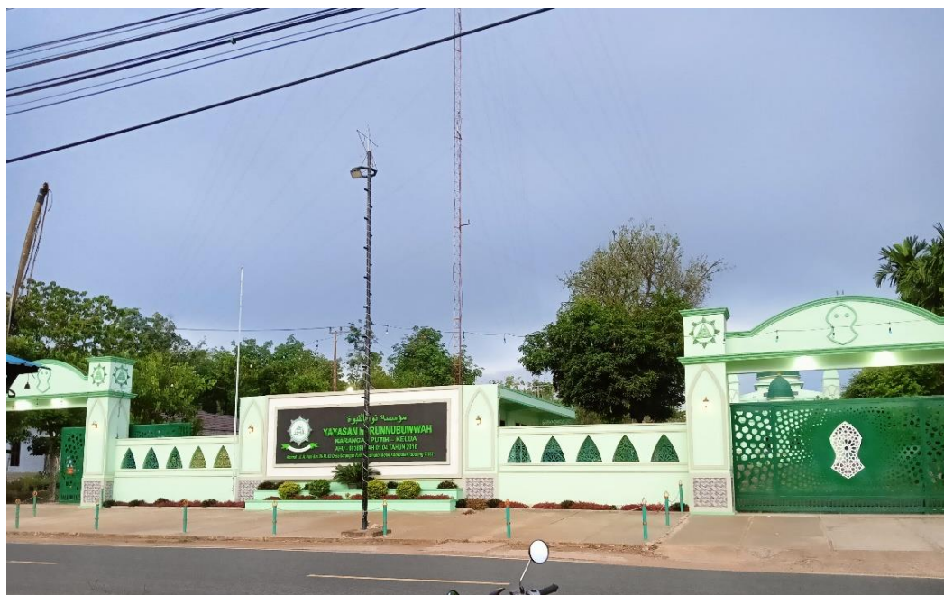
Gambar 4.2 Majelis Ta'lim Nurunnubuwwah Kecamatan Kelua

Selain Majelis Ta'lim Nurunnubuwwah yang berpusat di Desa Karangany Putih, Kecamatan Kelua, majelis ini juga memiliki cabang di berbagai daerah lainnya yaitu, di Desa Hariang Kecamatan Banua Lawas setiap hari Sabtu setelah shalat magrib, dan Desa Tamunti Kecamatan Pugaan setiap hari Jumat setelah shalat magrib.