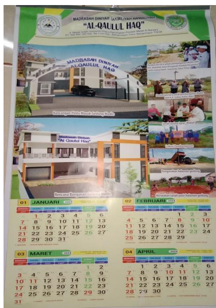
Gambar 4.4 Kalender MDTA Al-Qaulul Haq Simpang Limau

kepada orang tua atau wali santri ketika pengambilan raport semester ganjil. Sebagian juga dibagikan kepada warga sekitar dan toko yang ramai pengunjung. 7