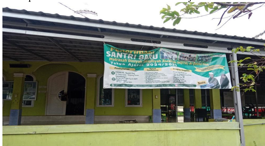
Gambar 4.3 Spanduk Penerimaan Santri Baru Tahun Ajaran 2024/2025