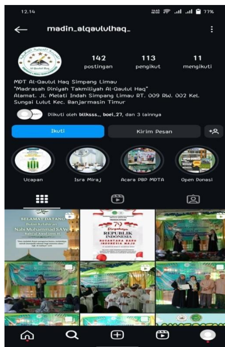
Gambar 4.5 Media Sosial Instagram MDTA Al-Qaulul Haq Simpang Limau