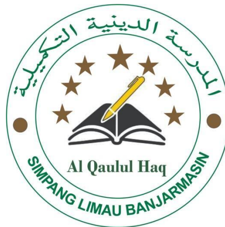
Gambar 4.1 Lambang MDTA Al-Qaulul Haq