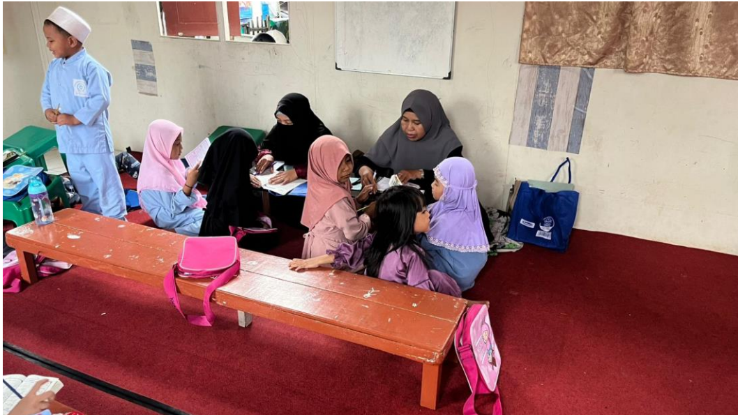
Gambar 4. 2 Aktivitas Belajar Mengajar di TPQ Ar Rahmah

sambil tetap mendapatkan pemahaman yang mendalam mengenai ajaran agama Islam.