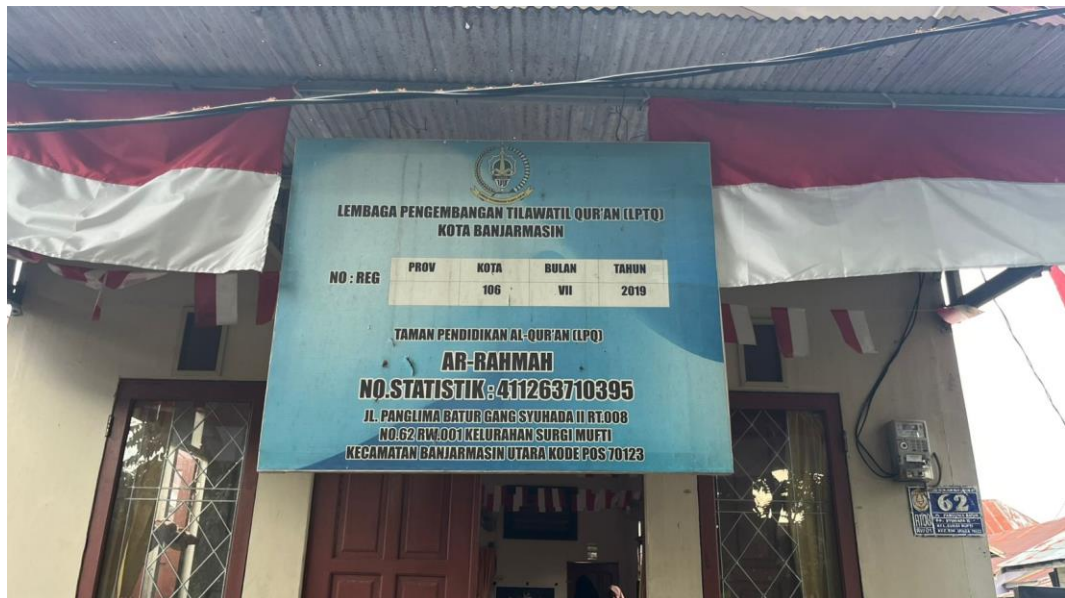
Gambar 4. 1 TPQ Ar Rahmag Sungai Jingah Banjarmasin

Taman Pendidikan Quran adalah salah satu lembaga atau sekolah yang menyediakan pendidikan agama yang terjangkau dan berkualitas bagi anak-anak yang berada dilingkungan sekitar. Sehingga bisa mampu membaca, memahami dan mengamalkan ilmu-ilmu agama dan Al-Quran di kehidupan sehari-hari.