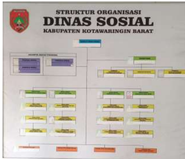
Gambar 4.2 Struktur Dinas Sosial di Kabupaten Kotawaringin Barat