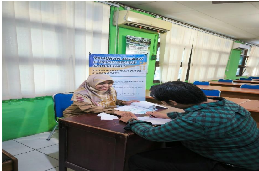
Gambar 3 Wawancara dengan Pustakawan