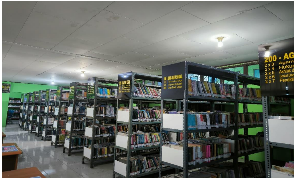
Gambar 7 Rak Koleksi