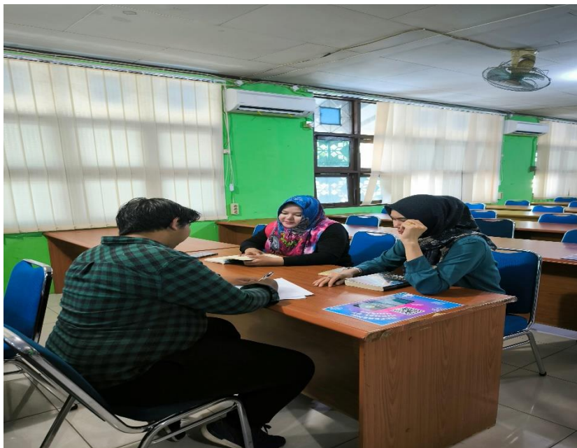
Gambar 4 Wawancara dengan Pemustaka