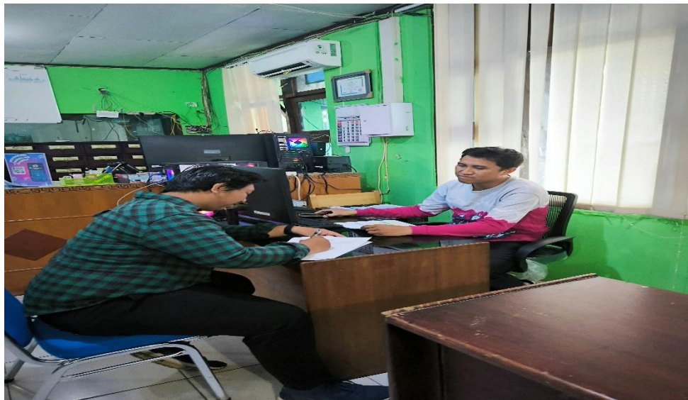
Gambar 5 Wawancara dengan Kepala Perpustakaan