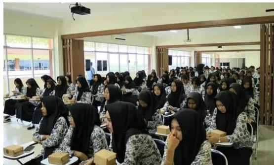
Gambar 10 Kelas Literasi