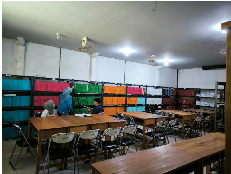
Gambar 2 Ruang Referensi