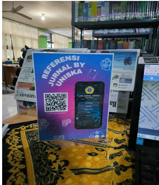
Gambar 9 Layanan Jurnal Elektronik