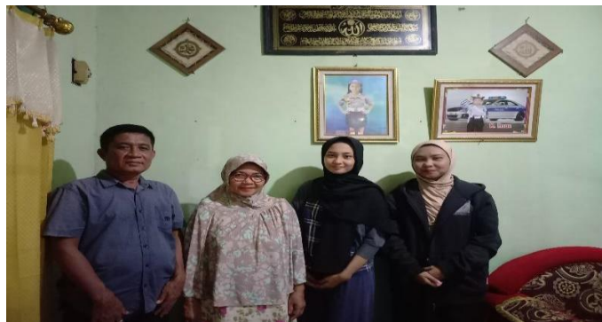
Wawancara dengan keluarga bapak SW dan ibu JM