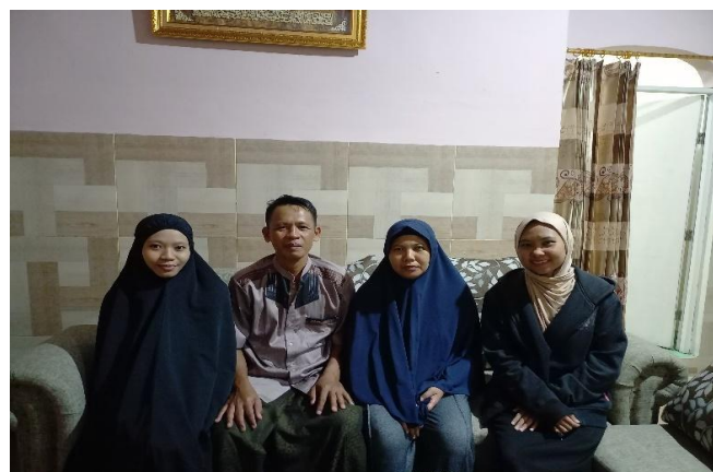
Wawancara dengan keluarga bapak DN dan ibu WS