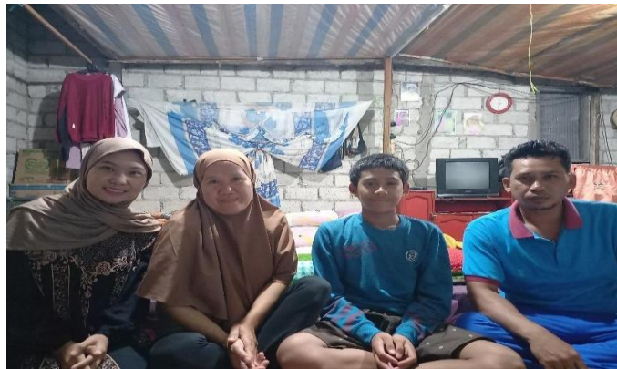
Wawancara dengan bapak YO dan ibu MY