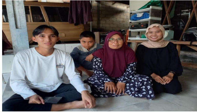
Wawancara dengan keluarga bapak MD dan ibu HJ