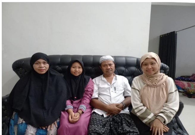
Wawancara dengan bapak HM dan ibu NH