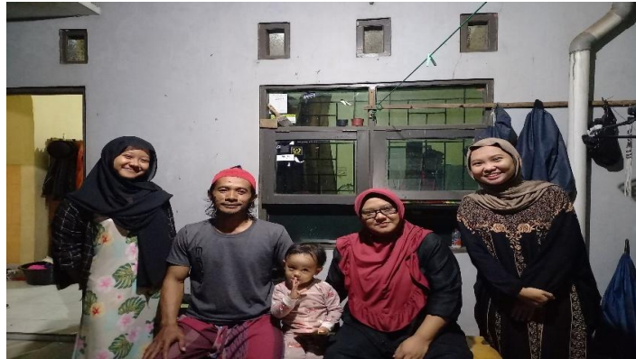
Wawancara dengan keluarga bapak SP dan ibu TH