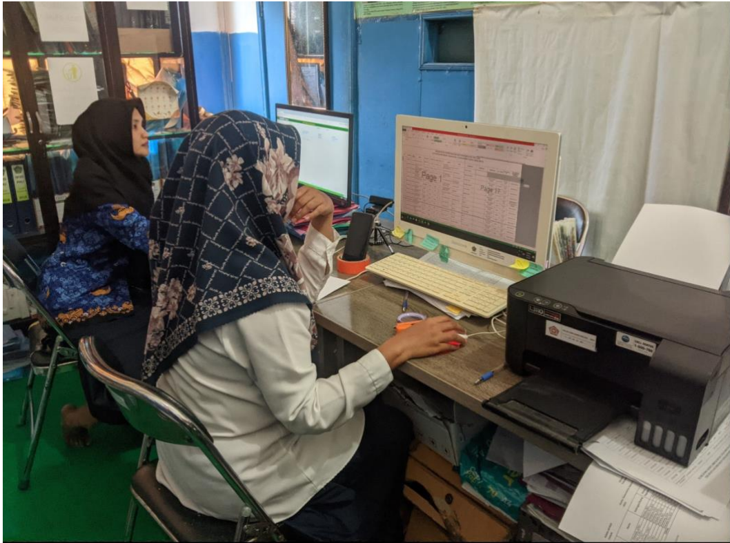
Proses Data Siskohat di Kemenag Tanbu