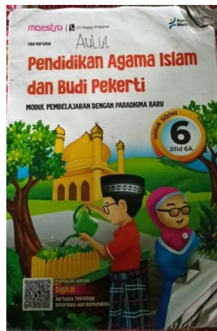
Gambar 4. 11 Buku PABP