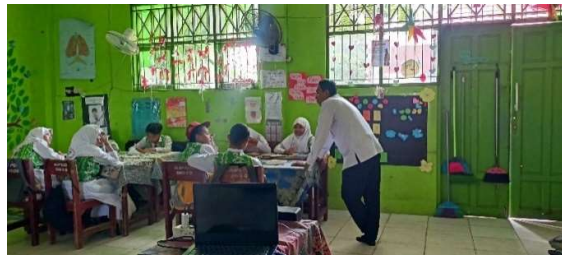
Gambar 4. 10 Sesi Tanya Jawab