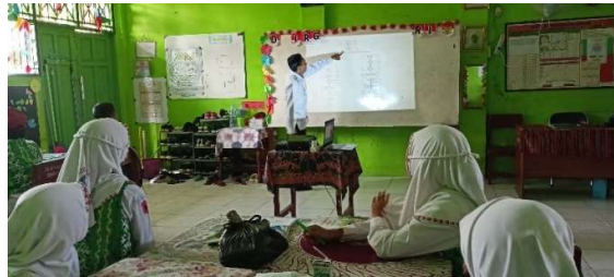
Gambar 4. 8 Penjelasan Materi