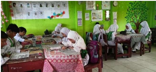
Gambar 4. 7 Menyimak Bacaan

Dengan demikian pembentukan karakter melalui keteladanan sangat sesuai dengan salah satu dari 18 nilai-nilai karakter yaitu penanaman karakter religius pada dasarnya dapat dikembangkan melalui salah satu dari dua model Pendidikan karakter yaitu terintegrasi dalam mata Pelajaran.