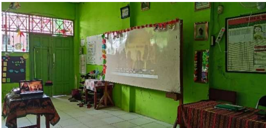
Gambar 4. 9 Menyimak Video