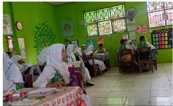
Gambar 4. 5 Antusias Peserta Didik