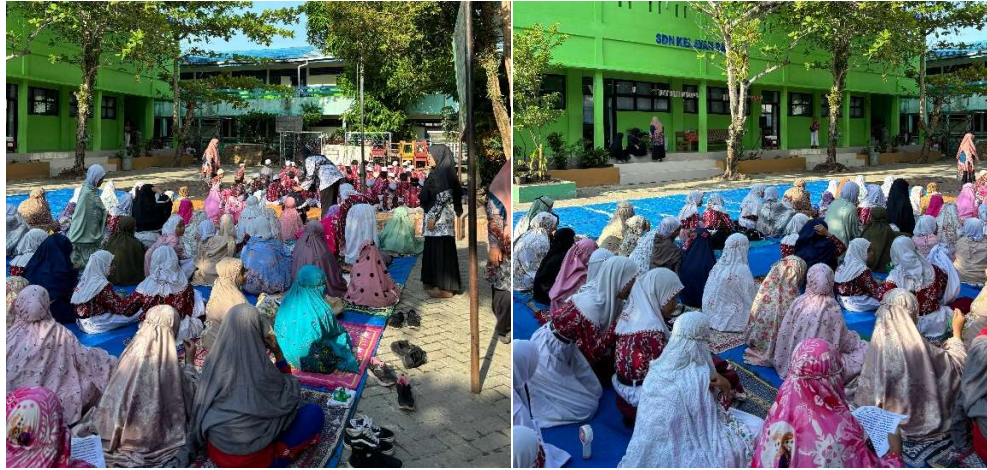
Gambar 4. 2 Jum'at Taqwa di Halaman Sekolah, Jum'at 27 September 2024

Jum'at Taqwa merupakan program sekolah yang rutin dilaksanakan setiap minggunya di halaman sekolah sebelum memasuki kelas untuk memulai proses belajar mengajar. Tujuan diadakannya Jum'at taqwa ialah untuk menumbuhkan pengetahuan peserta didik mengenai nilai-nilai keIslaman. Berdasarkan data yang tersaji, program Jum'at taqwa setiap minggunya dilaksanakan dengan program yang bervariasi seperti: