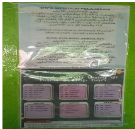
Gambar 4. 3 Jadwal Surah

Kegiatan pembelajaran di kelas setiap harinya dimulai dengan serangkaian aktivitas yang bertujuan untuk membangun karakter dan memperkuat nilai-nilai spiritual peserta didik. Sebagai langkah awal, seluruh peserta didik sama-sama membaca doa sebelum memulai pembelajaran, yang diharapkan dapat memohon