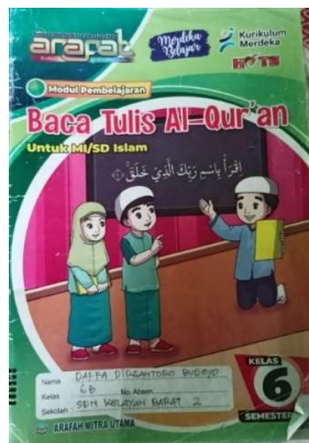
Gambar 4. 6. Buku BTA