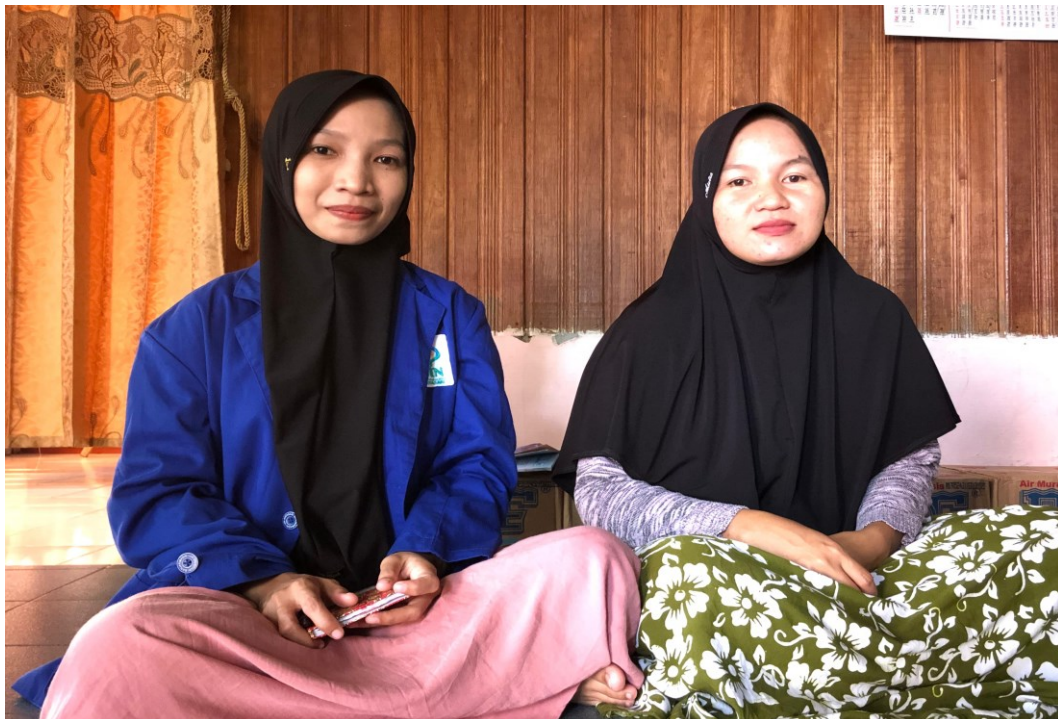
Wawancara dengan Ibu BK (12 Januari 2025)