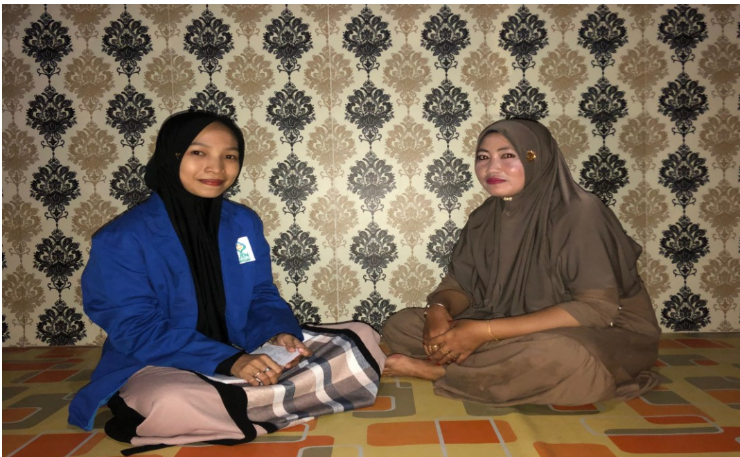
Wawancara dengan Ibu HM (4 Juli 2023)