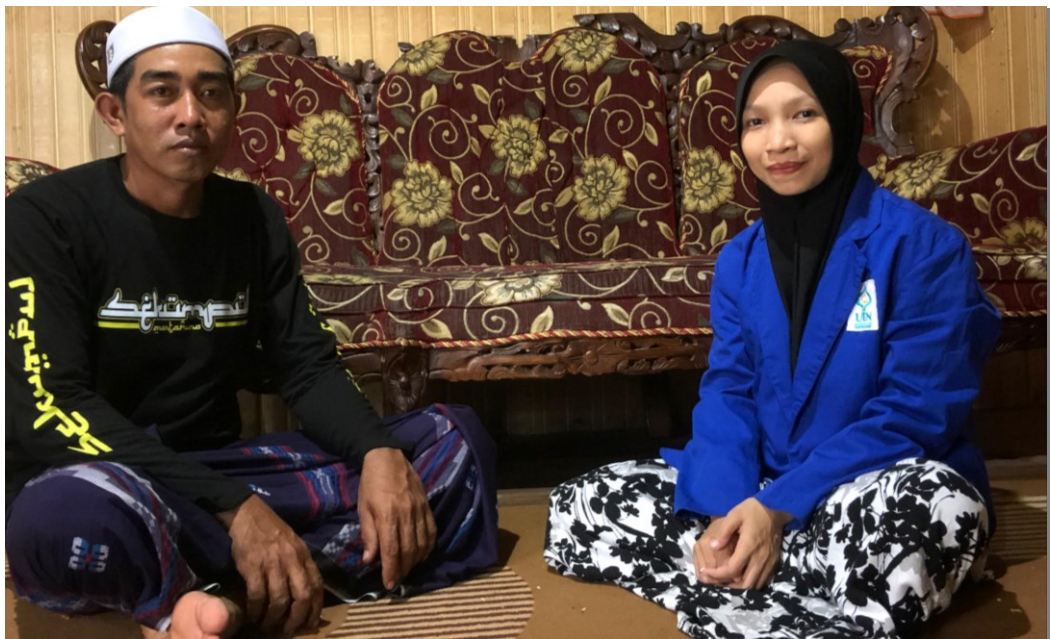
Wawancara dengan Bapak F (13 Januari 2025)