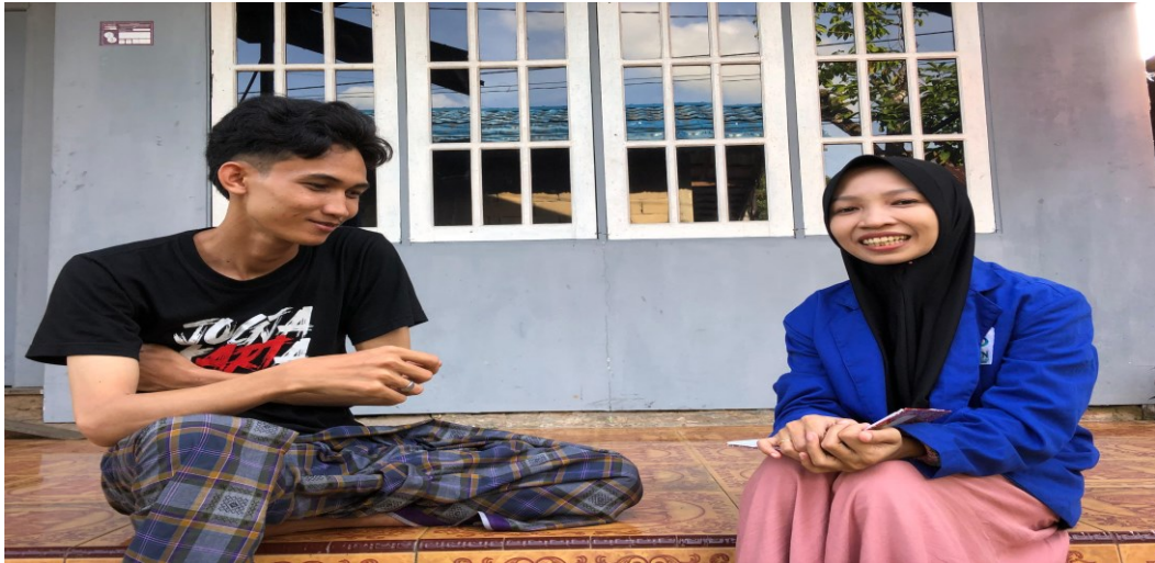
Wawancara dengan saudara O (12 Januari 2025)