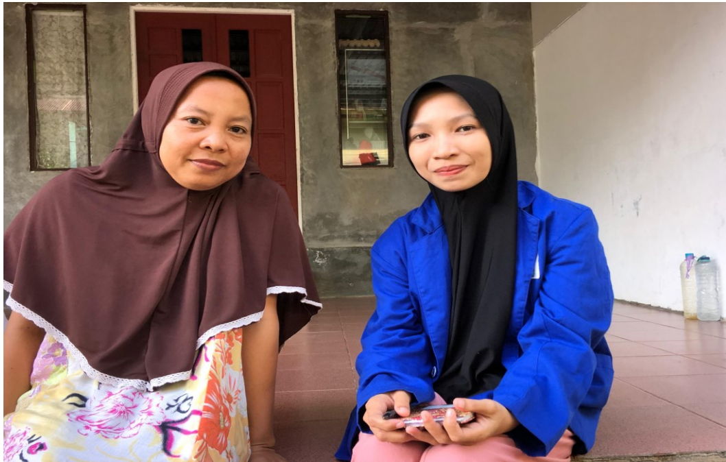
Wawancara dengan Ibu SA (12 Januari 2025)