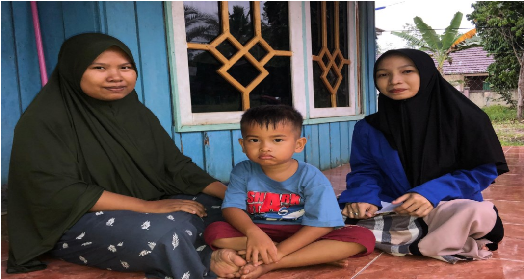
Wawancara dengan Ibu FZ (4 Juli 2023)