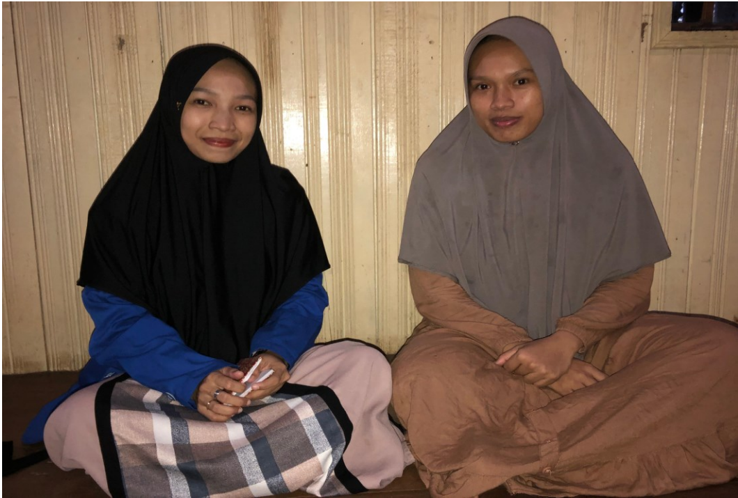
Wawancara dengan Ibu HW (4 Juli 2023)