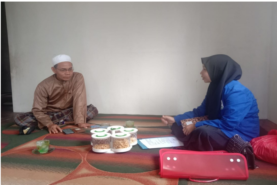
Wawancara dengan Tokoh Agama (2 Juli 2023)