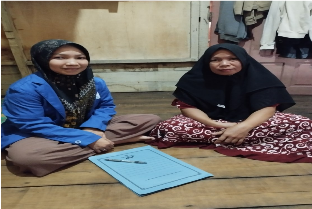
Wawancara dengan Ibu AH (25 Juli 2023)