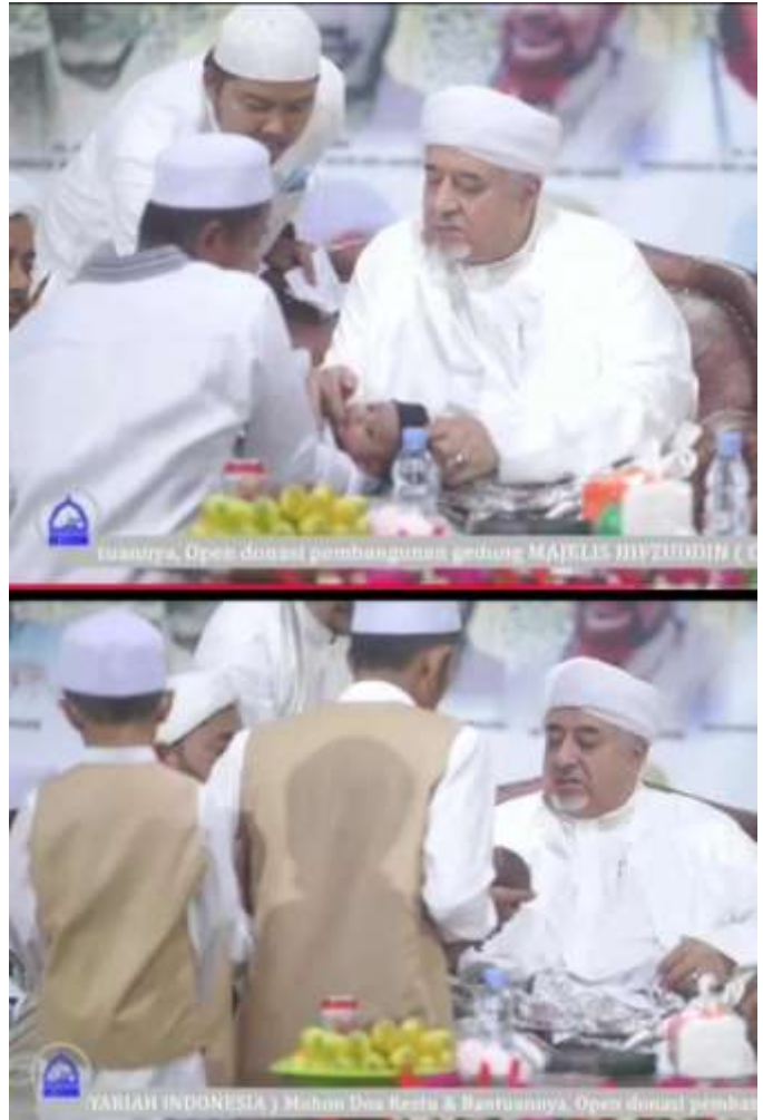
Tasmiyah dan Tahnik bayi