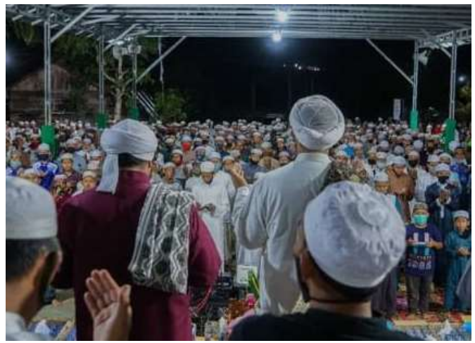
Kegiatan Pengajian Rutinan Majelis Hizduddin Cempaka