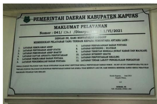
Gambar 4.5 Layanan Di Perpustakaan