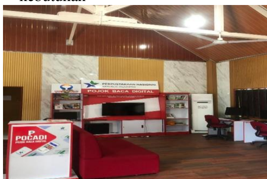
Gambar 4.4 Pojok Baca Digital

“Kalo perpustakaan ini sudah ada spot baca dan pojok baca digital, aplikasi iKapas, aplikasi bacaan buku digital, layanan peminjaman buku, layanan referensi serta wifi gratis. Banyak manfaat dari perpustakaan digital ini seperti bisa diakses banyak orang, bisa dibuka kapanpun selama 24 jam, data bersifat digital serta pemustaka dapat memilih bebas data dan informasi sesuai dengan kebutuhan” 39