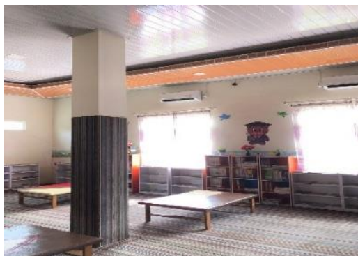
Gambar 4.2 Koleksi Fisik

dibutuhkan baik fisik maupun digital yang dibuat melalui kuesioner terlebih dahulu.