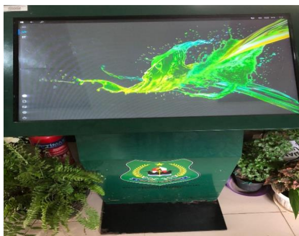
Gambar 4.6 Komputer

“Kita menggunakan komputer pengelolaan nya itu komputernya internet nya harus konek berbasis internet kalo bacaan bacaan digital dan pengelolaannya sesuai dengan prosedur pelayanan” 47