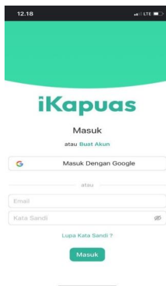
Gambar 4.1 Aplikasi Ikapuas