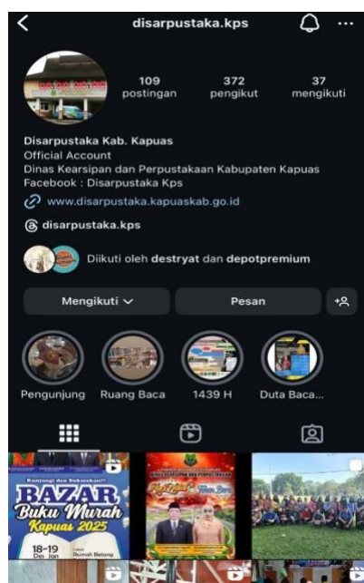
Gambar 4.7 Sosmed Perpustakaan Daerah Kabupaten Kuala Kapuas

“Pemantauan dari pihak perpustakaanya sendiri serta kalo ada ketidakpuasan pemustaka terhadap layanannya bisa di tulis di media sosial seperti instagram dan juga bisa ditulis di kotak saran”.