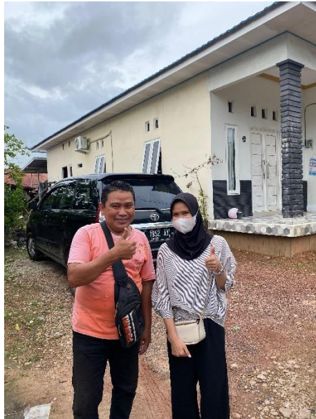
Wawancara Bapa Adi, Jl.