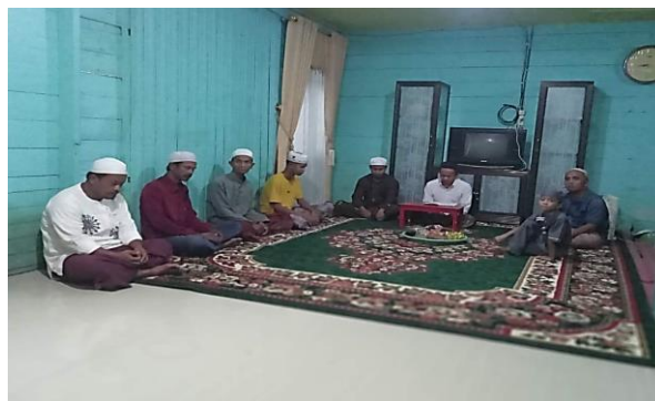
Gambar 4. 5 Acara Pembacaan Manaqib Sekaligus Selamatan

Kata "manaqib" berasal dari bahasa Arab yang berarti biografi dan Kata selamatan dalam bahasa Arab salamah, yang berarti selamat atau bahagia, adalah asal kata dari kata "selamatan". Praktik ini telah ada sejak zaman sebelum Islam dan merupakan hasil dari akulturasi antara ajaran Islam dan kepercayaan lokal. Acara selamatan biasanya dimulai dengan doa bersama yang dipimpin oleh seorang pemimpin agama (ustadz). Kemudian, acara biasanya diakhiri dengan makan bersama. Beberapa jenis selamatan adat ini termasuk perayaan agama dan selamatan yang berkaitan dengan kehidupan, seperti kelahiran dan kematian. Desa bersih adalah upaya integrasi sosial . Kejadian unik, misalnya perjalanan jauh atau penyembuhan penyakit Selamatan memperkuat hubungan sosial dan spiritual.