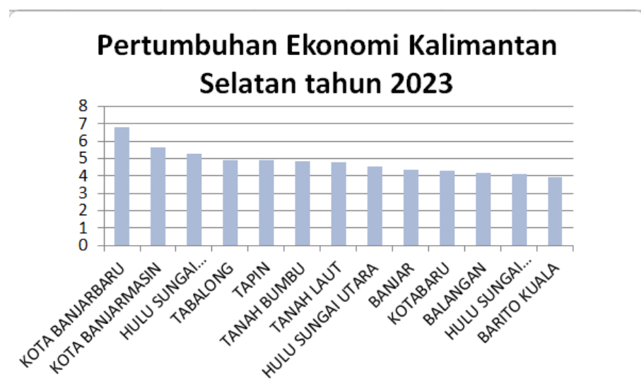
Gambar 1. 2 Pertumbuhan Ekonomi Kalsel Tahun 2023

Kemudian, lapangan usaha administrasi pemerintahan pertahanan dan jaminan sosial wajib mencatat pertumbuhan tertinggi sebesar 3,71 persen, informasi dan komunikasi 3,67 persen dan penyediaan akomodasi dan makan minum 1,12 persen.