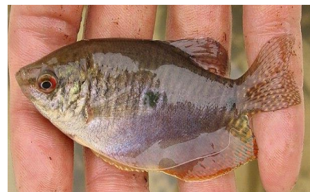
Gambar 4.1b Literatur Ikan sapat

Trichogaster trichopterus atau ikan sapat ditemukan di zona I dan II. Mempunyai jari-jari masing-masing 8 sirip keras, 8 sirip lunak, 14 sirip ekor, dan 10 sirip dada. Tinggi sirip punggung 1 cm, tinggi sirip dubur 0,8 cm, dan tinggi sirip perut 9 cm. Ikan sapat berwarna abu-abu kehitaman dengan perut berwarna putih mengkilat dan badan berwarna putih keperakan. Ikan sapat