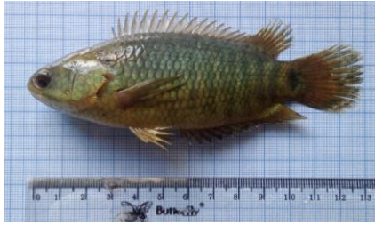
Gambar 4.6a Ikan papuyu