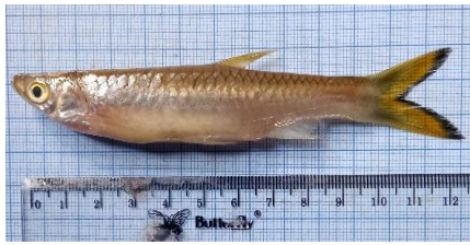
Gambar 4.9a Ikan saluang batang