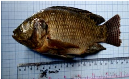
Gambar 4.3a Ikan nila