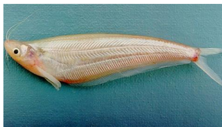
Gambar 4.11b Literatur Ikan lais

Kryptopterus apogon atau disebut ikan lais terdapat pada zona I. sirip lunak 7, sirip ekor 13, sirip dada 10, sirip perut 7, sirip dubur 29. Tinggi sirip dubur 0,5 cm. Ikan lais mempunyai sisik berwarna abu-abu kehitaman, perut berwarna abu-abu kekuningan, dan badan berwarna abu-abu. Ikan Lais mempunyai tubuh yang berukuran panjang baku 17 cm, panjang total 19 cm, dan tinggi 4 cm. Ekor ikan Lais berukuran tinggi 1 cm dan panjang 4 cm. Ikan Lais mempunyai panjang antara mata dan lebar mata 1,8 cm, lebar bukaan mulut 1,5 cm, dan panjang antara moncong dan kepala 1,2 cm. Ikan lais mempunyai ciri khusus yaitu mempunyai sungut dan mempunyai badan yang rata, licin dan tidak bersisik.