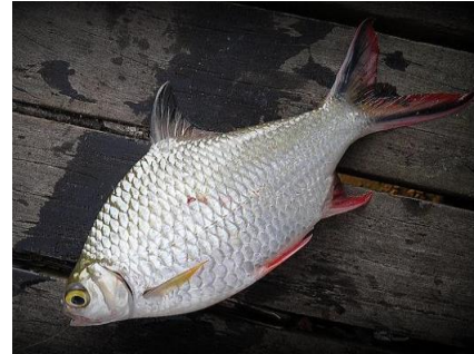
Gambar 4.4b Literatur Ikan tengadak

Puntius schwanefeldi (Blkr) atau ikan tengadak terdapat pada zona I dengan ciri-ciri mempunyai jari-jari 3 sirip keras, 7 sirip lunak, 21 jari sirip ekor, 12 jari sirip dada, 10 jari sirip perut, jari sirip dubur 7. Ikan Tengadak memiliki sisik berwarna keperakan di bagian depan, perut berwarna keperakan, dan badan berwarna keperakan. Ikan ini memiliki panjang tubuh 15 cm dan tinggi 6 cm. Ikan sapat siam mempunyai batang ekor yang tingginya 2,9 cm dan panjang 3,5 cm. Kepala ikan tengadak berukuran panjang 1,5 cm, lebar 1,3 cm, dan panjang 1 cm, memiliki sisik berwarna putih dan sirip berwarna oranye.