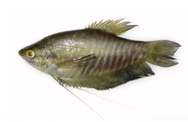
Gambar 4.2b Literatur Ikan sapat siam

Ikan sapat siam ( Trichogaster pectoralis Regan) terdapat pada zona I dan II memiliki jari-jari sirip keras 5 buah, sirip lunak 9 buah, sirip ekor 16 buah, sirip dada 10 buah, sirip perut 11 buah, dan sirip dubur 25 buah. Ikan sapat siam memiliki sisik hitam di punggung, perut berwarna putih kehijauan, dan badan berwarna putih. Ikan sapat siam berukuran panjang baku 13 cm, panjang seluruhnya 15,5 cm, dan tinggi 5 cm. Ekor ikan sapat siam tingginya sekitar 1,2 cm dan panjang 1,7 cm. Ikan sapat siam mempunyai kepala yang panjangnya 1,7 cm diantara mata dan penutup insangnya. Ikan sapat siam memiliki jarak 1,3 cm antara mata dan mulutnya, memiliki bukaan mulut 0,8