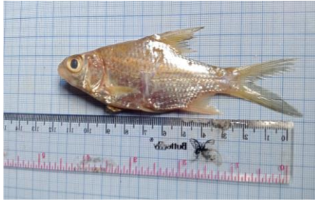
Gambar 4.7a Ikan tawes