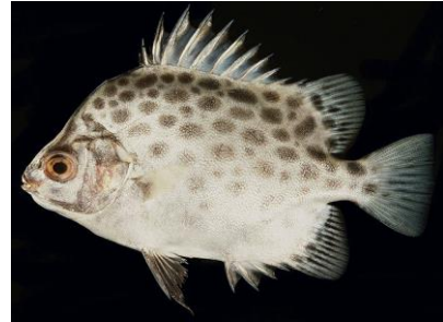
Gambar 4.5b Literatur Ikan kipar

Sctophagus argus atau ikan kipar terdapat pada zona I dan mempunyai 11 sirip keras, 11 sirip lunak, 13 jari-jari sirip ekor, 12 sirip dada, dan 6 sirip perut. Sirip dubur memiliki 4 sirip keras dan 12 sirip lemah. Sirip punggung tinggi 2,7 cm, sirip dubur tinggi 1,2 cm, tinggi sirip perut 2,7 cm, dan panjang sirip dada 1,8 cm. Ikan kipar memiliki sisik punggung berwarna hijau dan bintik hitam, perut berwarna putih mengkilat, dan tubuh berwarna putih hingga abu-abu kehijauan. Tubuh ikan kipar berukuran panjang baku 12,5 cm, panjang seluruhnya 15,3 cm, dan tinggi 8 cm. Ikan kipar mempunyai batang ekor yang panjangnya 1,5 cm dan tinggi 1,7 cm. Kepala ikan kipar berukuran panjang 2 cm, panjang antar lebar mata 1,2 cm, dalam 0,5 cm, dan moncong 0,6 cm. Ikan kipar mempunyai bentuk khusus yaitu berbentuk persegi empat dan pipih dan juga memiliki bintik hitam di tubuhnya.