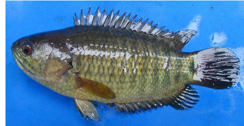
Gambar 4.6b Literatur Ikan papuyu

Anabas testudineus atau ikan papuyu terdapat pada zona 1 dan 2. Memiliki 18 sirip keras, 8 sirip lunak, jari-jari 13 sirip ekor, 15 sirip dada, 6 sirip perut, 9 sirip dubur, sirip punggung tinggi 1 cm, tinggi sirip dubur 0,8 cm, 0,6 cm tinggi tinggi sirip perut, dan tinggi sirip punggung 1 cm. Ikan Papuyu mempunyai sisik punggung berwarna hitam, perut berwarna putih kehijauan, dan badan berwarna hijau kehitaman. Tubuh ikan papuyu berukuran panjang baku 10,5 cm, panjang total 13 cm, dan tinggi 4 cm. Ikan papuyu mempunyai batang ekor yang tingginya 1,5 cm dan panjang 1,3 cm. Kepala ikan papuyu berukuran panjang 2,2 cm dan lebar 1 cm. Bukaan mulut 0,7 cm dan moncong 0,7 cm. Matanya hitam, ikan papuyu mempunyai ciri spesifik yaitu tubuh berbentuk panjang dan semakin kebelakang semakin tipis dan siripnya berduri.