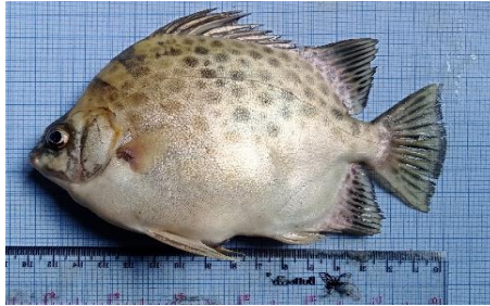
Gambar 4.5a Ikan kipar