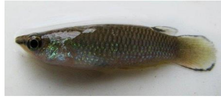
Gambar 4.13b Literatur Ikan timah

Panchax panchax atau ikan timah terdapat pada zona I dan zona II dengan ciri-ciri yaitu, sirip lunak 7 buah, sirip ekor 9 buah, sirip dada 15 buah, sirip perut 7 buah, sirip dubur sebanyak 15 buah, dan sirip punggung sebanyak 15 buah. Ikan timah mempunyai sisik abu-abu di punggung, perut putih, dan tubuh putih hingga keabu-abuan. Tubuh ikan timah berukuran panjang baku 4 cm, panjang total 5 cm, dan tinggi 0,6 cm. Ekor ikan timah berukuran panjang 1 cm dan tinggi 0,4 cm, Ikan timah memiliki panjang kepala 0,6 cm, lebar mata 0,4 cm, bukaan mulut 0,3 cm, panjang moncong dengan costa 0,4 cm, dan mata berwarna hitam. Ikan timah memiliki keunikan karena memiliki bintik putih di kepalanya yang mirip timah dan satu bintik hitam di sirip punggung.