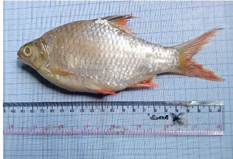
Gambar 4.4a Ikan tengadak