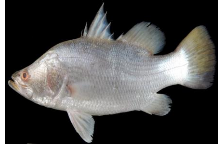
Gambar 4.14b Literatur Ikan kakap

Lates calcarifer atau ikan kakap terdapat pada zona I. Memiliki 9 sirip keras, 13 sirip lunak, 16 sirip ekor, 17 sirip dada, dan sirip perut keras 1 buah dan 6 buah lunak. Sirip punggung tinggi 1,5 cm, sirip dubur panjang 1,5 cm, sirip perut tinggi 1 cm, dan tinggi sirip dada 1,2 cm. Ikan kakap memiliki sisik berwarna hitam keperakan di bagian depan, perut berwarna perak, dan badan berwarna hitam. Tubuh ikan kakap berukuran panjang baku 11,5 cm, panjang total 14 cm, dan tinggi 5 sentimeter. Ekor ikan kakap mempunyai tinggi 1 cm dan panjang 1,5 cm. Kepala ikan kakap berukuran panjang 2 cm, lebar 0,8 cm, dan lebar 0,5 cm. Matanya hitam, ikan kakap mempunyai ciri-ciri khusus, badan yang memanjang dan gepeng serta bagian sirip punggung cembung.