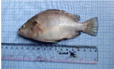
Gambar 4.14a Ikan kakap