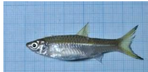
Gambar 4.9b Literatur Ikan saluang Sumber: Destiara, 2018

Rasbora aurotaenia atau ikan saluang banyak ditemukan di zona I dan II. Mereka memiliki tiga sirip keras, 7 sirip lunak, 21 sirip ekor, 10 sirip dada, 18 sirip perut, 6 sirip dubur, panjang sirip punggung 1,5 cm, tinggi sirip dubur 0,7 cm, tinggi sirip perut 0,9 cm, dan 1,6 cm tinggi sirip dada. Ikan saluang berwarna putih, perutnya putih mengkilat, dan badannya putih mengkilat. Ikan saluang mempunyai tubuh yang berukuran panjang baku 10 cm, panjang total seluruhnya 12,5 cm, dan tinggi 2 cm. Ekor ikan saluang mempunyai tinggi 1,8 cm dan panjang 1 cm. Kepala ikan saluang berukuran panjang 0,8 cm dan lebar 0,8 cm. Bukaan mulut lebar 1 cm dan panjang 2,7 cm. Matanya hitam, ikan saluang berbentuk memanjang dan pipih, dengan garis-garis hitam di ujung sirip ekornya.