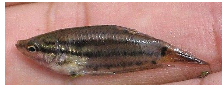
Gambar 4.12b Literatur Ikan kelatau

Trichaptis vittatus atau ikan kelau terdapat pada zona I dan zona II dengan ciri-ciri yaitu sirip lunak berjumlah 8 buah, sirip ekor berjumlah 9 buah, sirip dada berjumlah 13 buah, dan jari sirip perut berjumlah 7 buah. Ikan Kelatau memiliki sisik punggung berwarna hitam, perut berwarna hitam kehitaman, dan tubuh berwarna coklat kehitaman. Ikan Kelatau mempunyai panjang baku 3,1 cm, panjang total 4,2 cm, dan tinggi 0,8 cm. Ikan Kelatau mempunyai batang ekor yang tingginya 0,5 cm dan panjang 0,4 sentimeter. Ikan Kelatau memiliki panjang kepala 0,5 cm, lebar mata 0,3 cm, bukaan mulut 0,2 cm, dan panjang antara moncong dan costa 0,5 cm. Bagian tengah matanya berwarna hitam, dan pinggirannya berwarna putih. Ikan Kelatau mempunyai sisik yang kasar dan dapat dijadikan sebagai ikan hias.