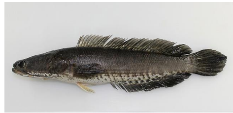
Gambar 4.10b Literatur Ikan haruan

Ophiocephalus striatus atau ikan haruan terdapat pada zona I dan 2. Memiliki sirip lunak sebanyak 41 buah, sirip ekor sebanyak 12 buah, sirip dada sebanyak 15 buah, sirip perut sebanyak 6 buah, dan sirip dubur sebanyak 24 buah. Sirip punggung tinggi 1,1 cm, tinggi sirip dubur 0,8 cm, tinggi sirip perut 1,4 cm, dan tinggi sirip dada 2,2 cm. Ikan gabus memiliki sisik berwarna coklat kehitaman di punggung, perut berwarna putih, dan badan berwarna hitam kecoklatan. Badan ikan gabus berukuran panjang baku 18 cm, panjang total 22 cm, dan tinggi 3 cm. Ikan gabus mempunyai ekor yang tingginya 1,5 cm dan panjang 2 cm. Ikan ini mempunyai kepala yang panjangnya 3,5 cm di antara mata dan penutup insangnya, memiliki mulut selebar 1,7 cm dan bermata hitam. Ikan gabus memiliki keistimewaan karena tubuhnya yang panjang dan kepalanya yang pipih, lebar, dan bersisik.