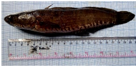
Gambar 4.10a Ikan haruan