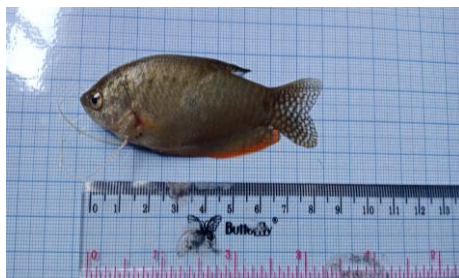
Gambar 4.1a Ikan sapat