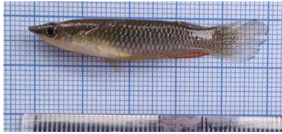
Gambar 4.13a Ikan timah