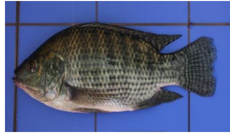
Gambar 4.3b Literatur Ikan nila

Oreochromis niloticus atau ikan nila, terdapat pada zona II dengan ciri memiliki jari-jari sirip keras 17 buah, 11 sirip lunak, 15 sirip ekor, 12 sirip dada, 12 sirip perut, 11 sirip dubur, 2 cm tinggi sirip punggung, 1 cm tinggi sirip dubur, sirip perut 1,8 cm, dan sirip dada 1 cm. Ikan nila memiliki kulit punggung berwarna hitam abu-abu, perut berwarna putih, dan tubuh berwarna perak mengkilat. Tubuh ikan nila berukuran panjang baku 14,5 cm, panjang seluruhnya 17,6 cm, dan tinggi 6 cm. Ikan nila memiliki tinggi batang ekor 2 cm dan panjang 2,2 cm. Ikan nila memiliki panjang kepala 2 cm, lebar mulut 1,7 cm, dan panjang moncong 2 cm. Ikan nila memiliki ciri-ciri khusus, seperti tubuhnya memiliki garis-garis vertikal dan mata yang tampak.