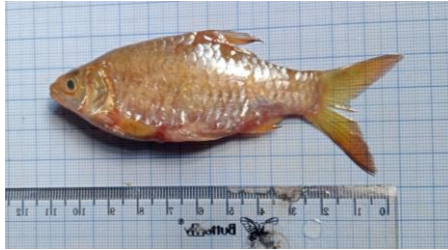
Gambar 4.8a Ikan kawan