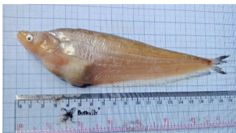
Gambar 4.11a Ikan lais