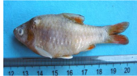
Gambar 4.8b Literatur Ikan kawan

Puntius tawarensis atau disebut ikan kawan yang ditemukan pada zona II dengan ciri-ciri: 2 sirip keras, 12 sirip lunak, 13 sirip ekor, 8 sirip dada, 9 sirip perut, sirip dubur 6. Sirip punggung tinggi 1,5 cm, tinggi sirip dubur 1 cm, tinggi sirip perut 1 cm, dan tinggi sirip dada 1,2 cm. Ikan kawan mempunyai sisik punggung berwarna putih, perut berwarna putih, dan badan berwarna putih kekuningan. Ikan kawan mempunyai ukuran tubuh yang panjang baku 8,5 cm, panjang totalnya 12 cm, dan tinggi 3,5 cm. Ekor ikan berukuran tinggi 1,3 cm dan panjang 1,6 cm. Kepala ikan berukuran panjang 1 cm, lebar 0,8 cm, dan lebar 0,7 cm. Bukaan mulutnya lebarnya 0,7 cm, dan panjang moncongnya 0,8 cm. Warna matanya hitam, ikan ini memiliki ciri khusus seperti punggung berbentuk segitiga dan sirip berwarna kekuningan.