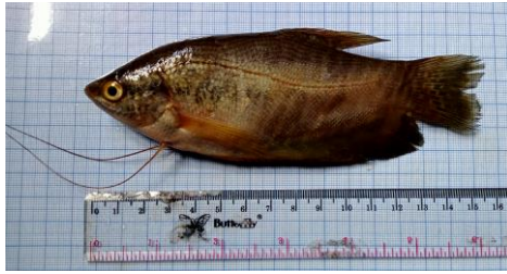
Gambar 4.2a Ikan sapat siam