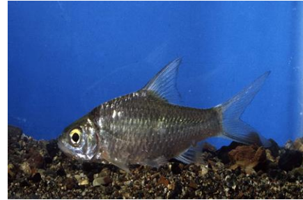
Gambar 4.7b Literatur Ikan tawes

Puntius javanicus (Blkr). atau ikan tawes terdapat pada zona I dan mempunyai ciri-ciri sebagai berikut: sirip keras 3 buah, sirip lunak 6 buah, sirip ekor 13 buah, dan sirip dada sebanyak 10 buah. Tinggi sirip punggung 2 cm, tinggi dubur 1,5 cm, tinggi sirip perut 1,5 cm, dan tinggi sirip dada 1,7 cm. Ikan tawes mempunyai sisik punggung berwarna perak, perut berwarna putih, dan badan berwarna putih. Ikan Tawes mempunyai tubuh yang berukuran panjang baku 8,5 cm dan panjang total 10,5 cm. Ekor ikan tawes berukuran panjang 1,2 cm dan tinggi 1 cm. Ikan Tawes memiliki panjang kepala antara mata dan penutup insang 1 cm, antara mata dan mulut 0,5 cm, antara moncong dan costa 0,9 sentimeter, serta mata berwarna hitam. Ikan tawes memiliki ciri khusus, seperti punggung berbentuk segitiga dan sirip berwarna putih mengkilat.