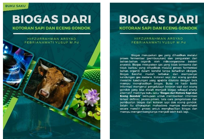
Gambar 7. Produk Prototipe I

Hasil eksperimen pembuatan biogas dari kotoran sapi dan eceng gondok kemudian dibuat menjadi sebuah produk buku saku yang dinamakan prototipe I.