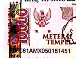
Noor Suci Fitriana