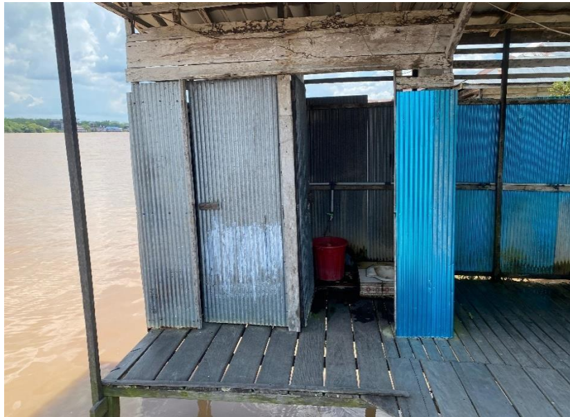
Gambar 4. 5 Gambar Toilet Masjid Al-Ikhlas

dilengkapi dengan fasilitas yang memadai seperti air bersih dan sabun. Perawatan rutin sangat penting untuk menjaga kebersihan dan ketersediaan fasilitas ini. 5