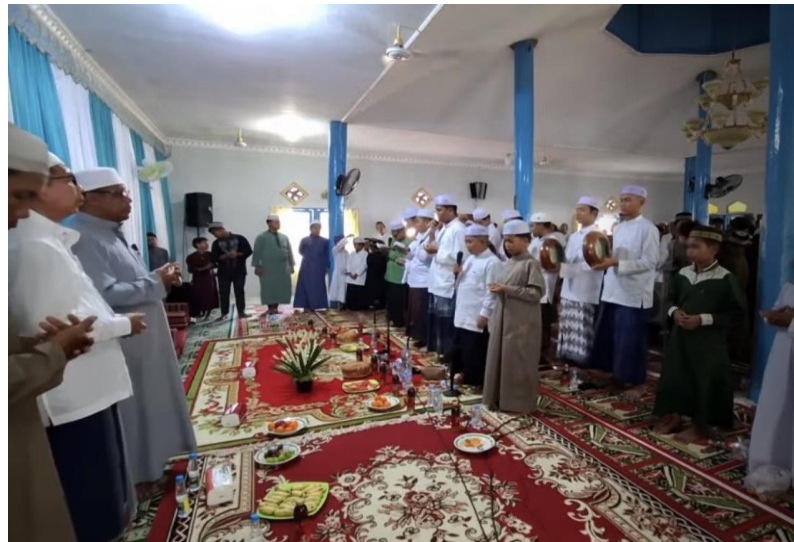
Gambar 4. 7 Dokumentasi Kegiatan Peringatan Hari Besar Islam Isra Mir'aj