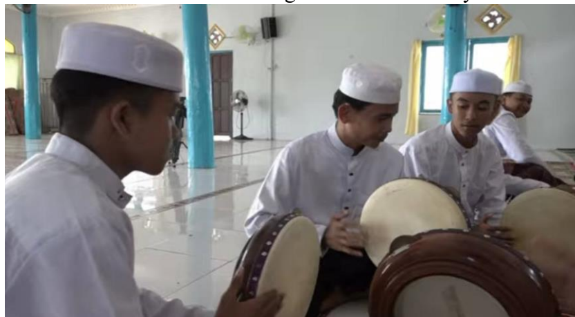
Gambar 4. 11 Dokumentasi Kegiatan Latihan Habsyi

Berdasarkan Observasi dan wawancara peneliti dengan ketua pengurus Masjid Al-Ikhlas Mandomai yaitu Anwar Sadat, pada tanggal 13 September 2024. Mengemukakan bahwa, program pelatihan habsyi ini bertujuan untuk meningkatkan partisipasi remaja dengan membangun karakter yang positif, melestarikan budaya Islam dan memperkuat ikatan dan keagamaan. 14