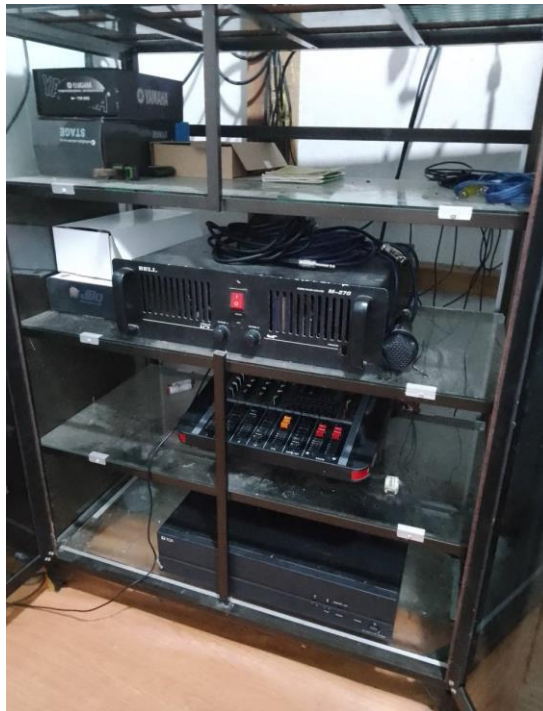
Gambar 4. 6 Gambar Sistem Audio Masjid Al-Ikhlas