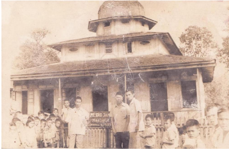
Gambar 4. 1 Gambar Masjid Al-Ikhlash Pada Tahun 1970