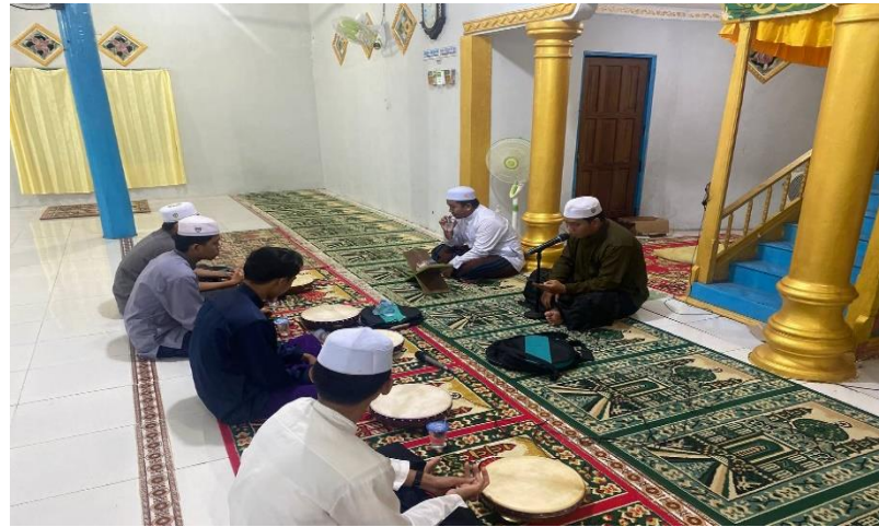
Gambar 4. 9 Dokumentasi kegiatan Pembacaan kitab Simthuddurar