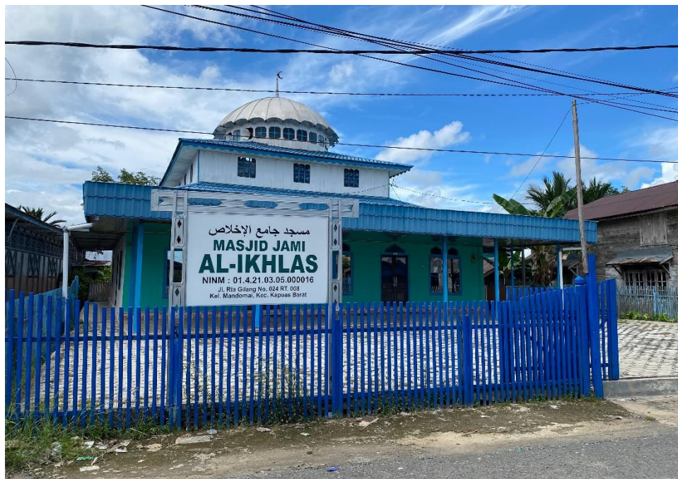
Gambar 4. 2 Gambar Masjid Al-Ikhlash Pada Tahun 2024