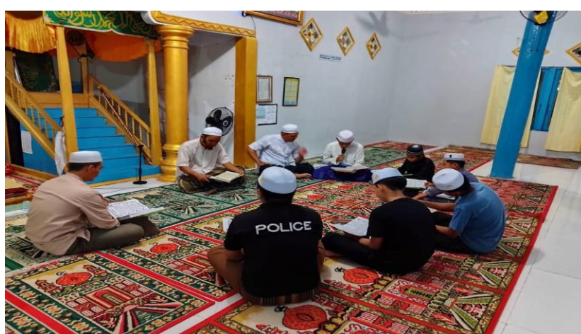
Gambar 4. 10 Dokumentasi kegiatan Tadarus Al-Qur'an

pada tanggal 13 September 2024. Tujuan utama dari kegiatan ini tentu untuk mendekatkan diri kepada Allah SWT. apalagi di bulan suci Ramadhan di mana setiap amalan dilipatgandakan pahalanya. Pengurus Masjid Al-Ikhlas menanamkan kebiasaan membaca Al-Qur'an di kalangan remaja, agar mereka tidak hanya sekedar membaca, tetapi juga memahami tajwid dan makna dari ayat-ayat dibaca. Pengurus masjid berharap kegiatan ini menjadi pembiasaan yang terus dilakukan di luar bulan Ramadhan. 13