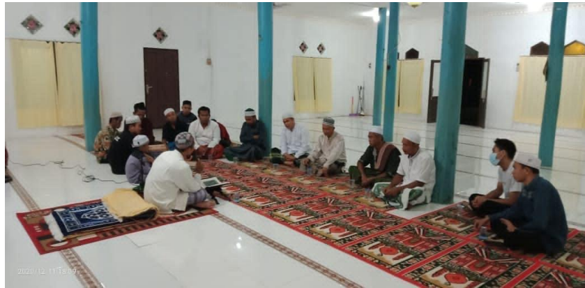
Gambar 4. 8 Dokumentasi Kegiatan Pembacaan Burdah