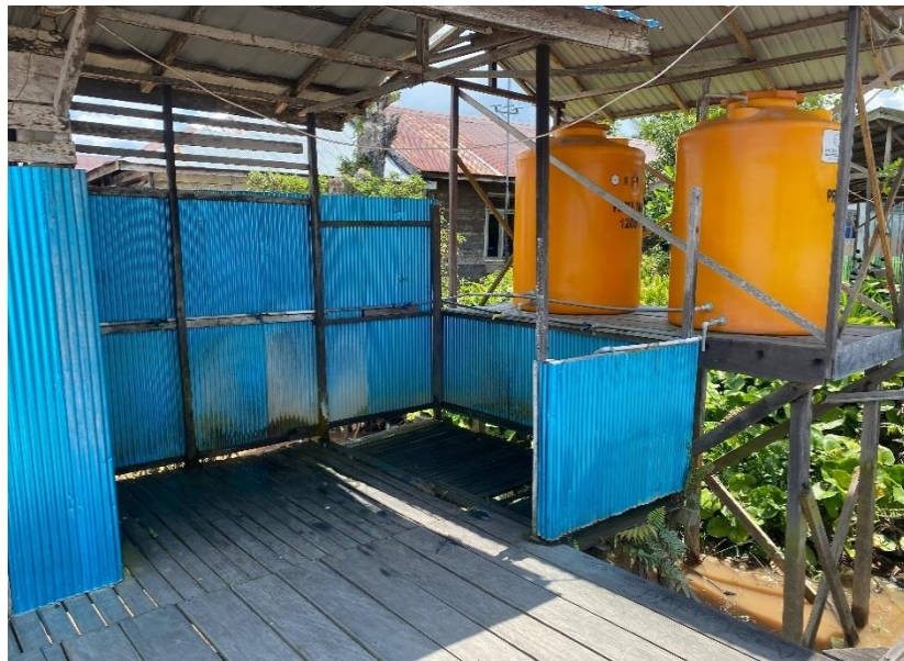
Gambar 4. 4 Gambar Tempat Wudhu Masjid Al-Ikhlas

Tempat wudhu merupakan fasilitas penting yang harus ada di setiap masjid. Area ini biasanya terletak diluar ruang shalat, dengan kran-kran air. Tempat wudhu harus selalu dijaga kebersihannya untuk memastikan kenyamanan dan kesehatan para jemaah. Selain itu, perlu disediakan sabun dan air yang cukup untuk keperluan bersuci. 4