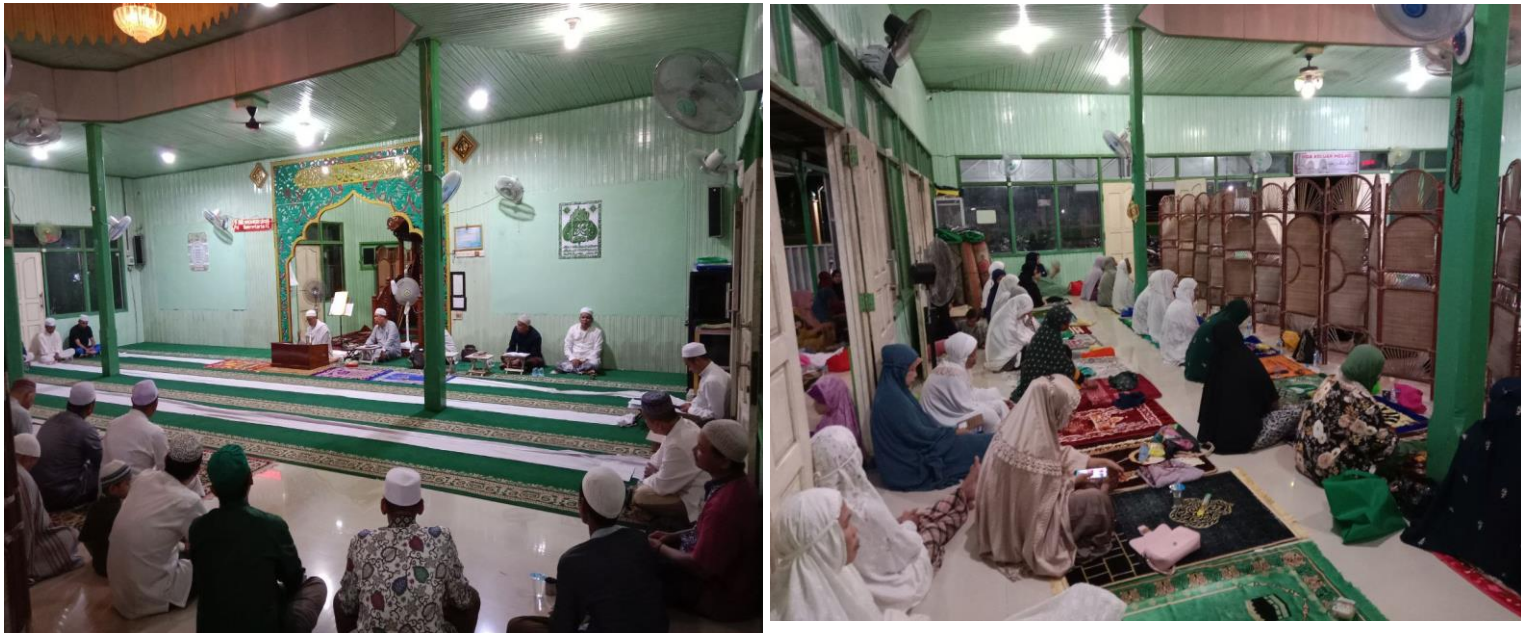
Foto Kegiatan Pengajian Malam Kamis