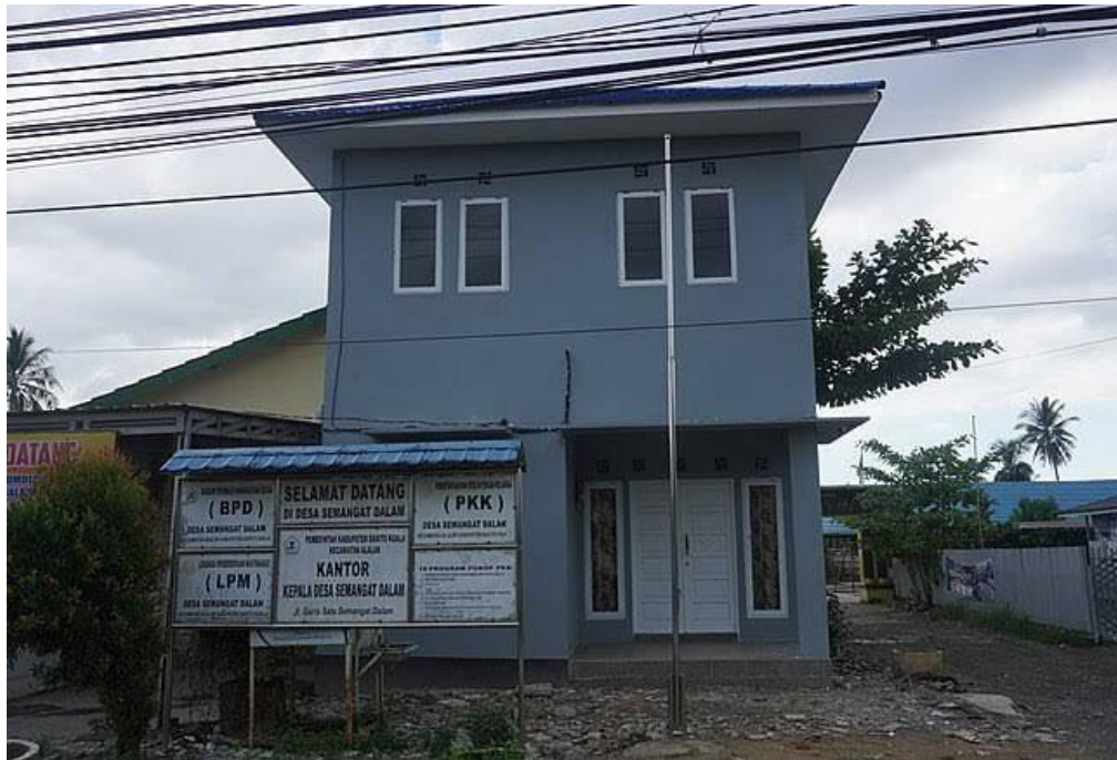
Kantor Desa Semangat Dalam