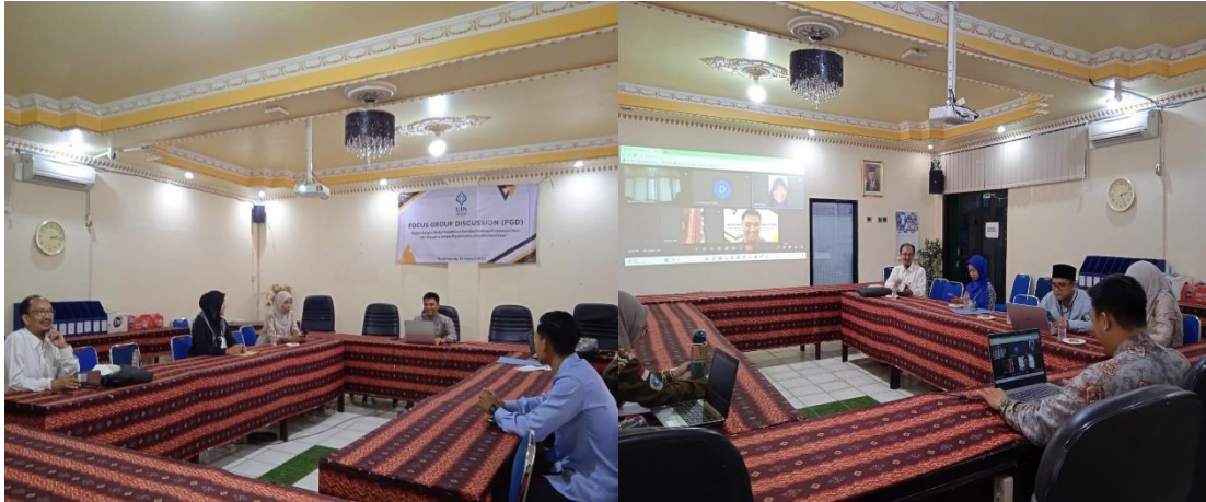
FOTO KEGIATAN FGD MEMBAHAS KISI-KISI INSTRUMEN DAN INSTRUMEN MONITORING SIMPEKGO