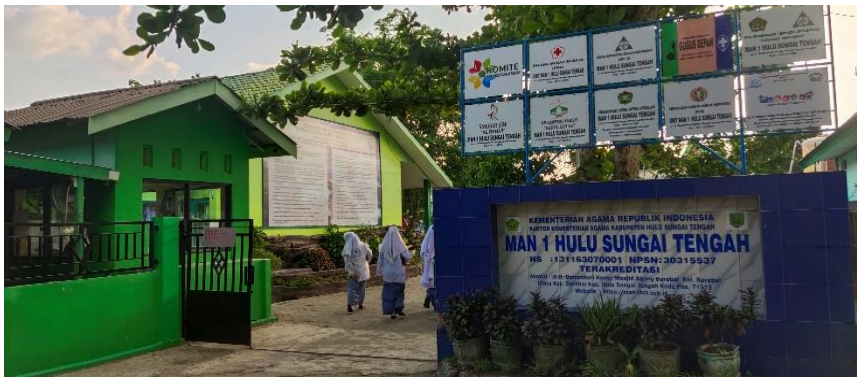
Kedaaan MAN 1 Hulu Sungai Tengah dari depan