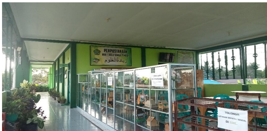
Perpustakaan MAN 1 Hulu Sungai Tengah