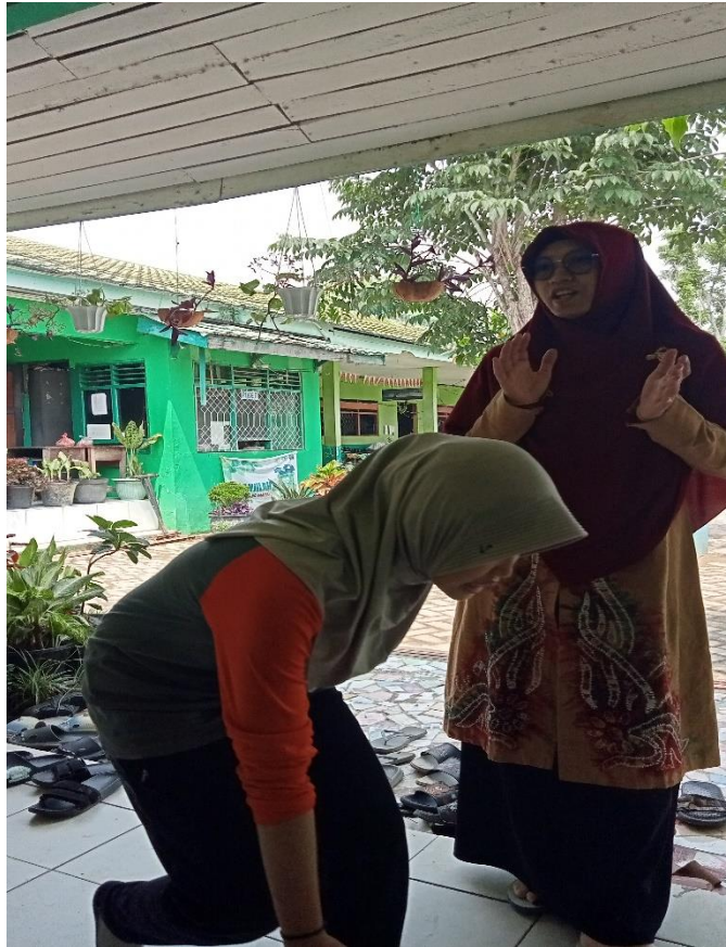
Sikap peserta didik ketika lewat di depan guru