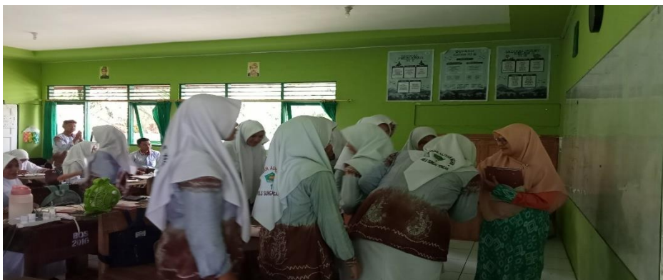
Peserta didik bersalaman dengan guru sesudah pembelajaran telah selesai