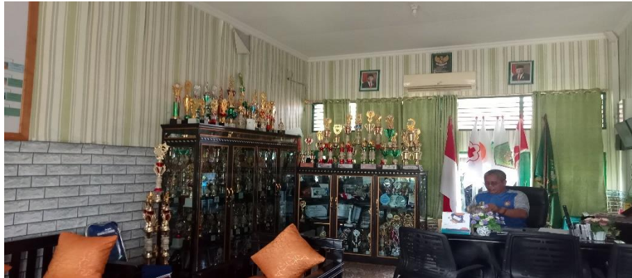
Ruang Kepala Sekolah MAN 1 Hulu Sungai Tengah