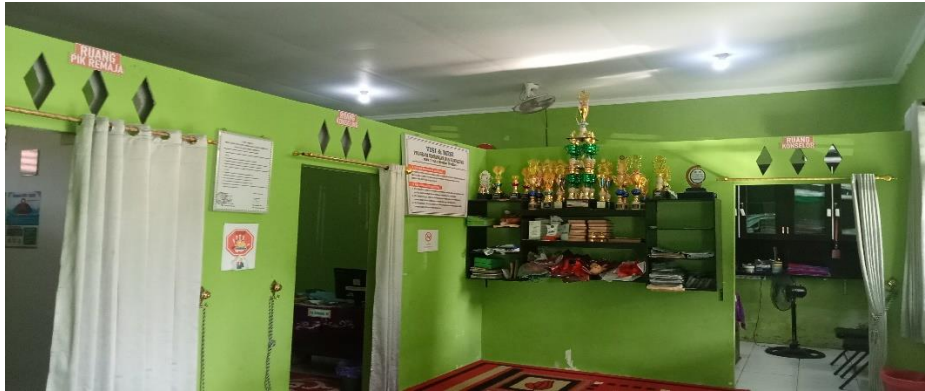
Ruang Bimbingan Konseling dan PIK Remaja MAN 1 Hulu Sungai Tengah