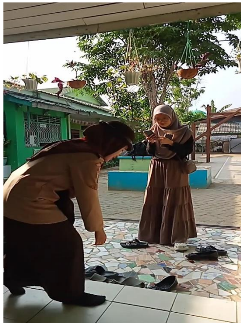
Sikap peserta didik ketika ingin melewati orang yang lebih dewasa