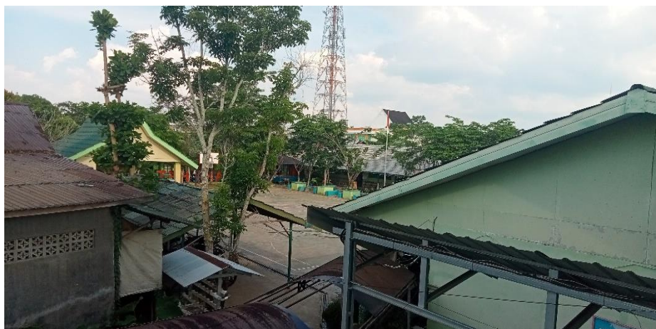
Kedaaan MAN 1 Hulu Sungai Tengah dari atas