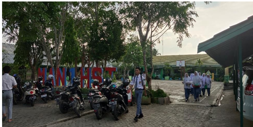
Kedaaan MAN 1 Hulu Sungai Tengah dari dalam