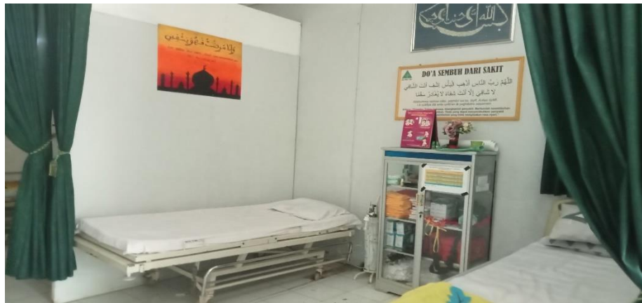
Ruang UKS MAN 1 Hulu Sungai Tengah