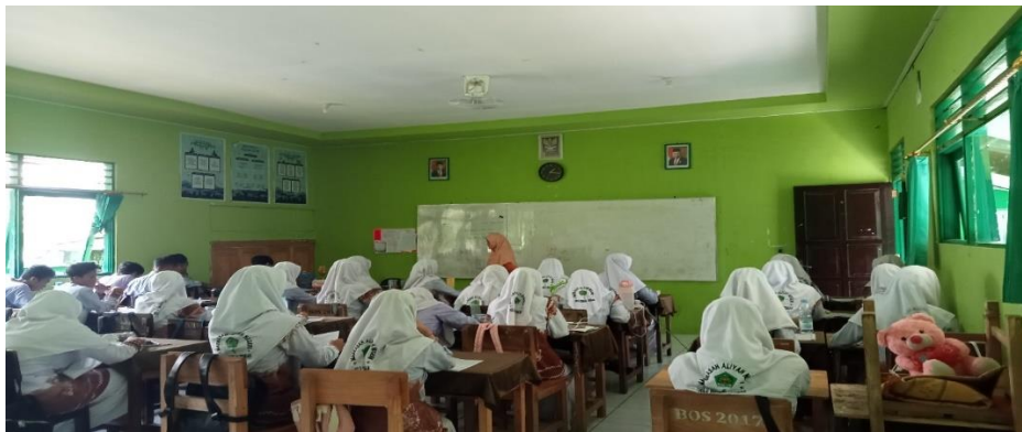
Keadaan kelas ketika pembelajaran