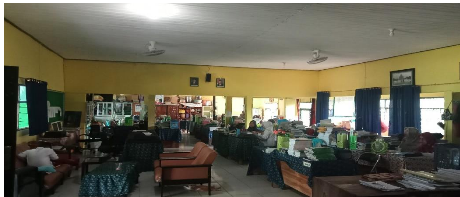
Ruang guru-guru MAN 1 Hulu Sungai Tengah