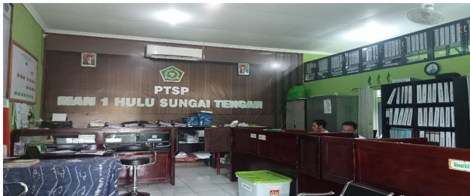
Ruang Tata Usaha MAN 1 Hulu Sungai Tengah