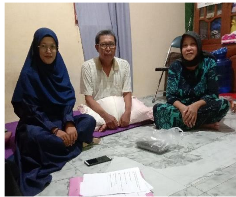
Foto bersama keluarga AS