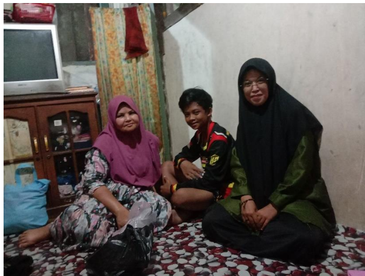
Foto bersama keluarga UH