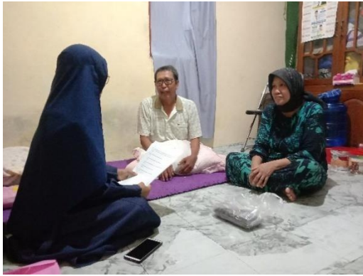
Foto bersama keluarga AS