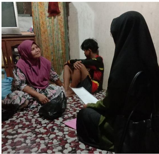
Foto bersama keluarga UH