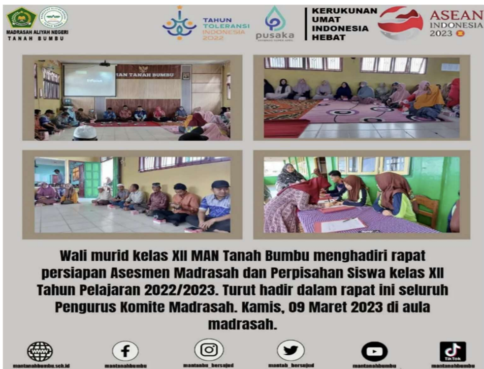
Gambar 2.14 Sosialisasi oleh Kepala Madrasah, Sarpras dan Humas