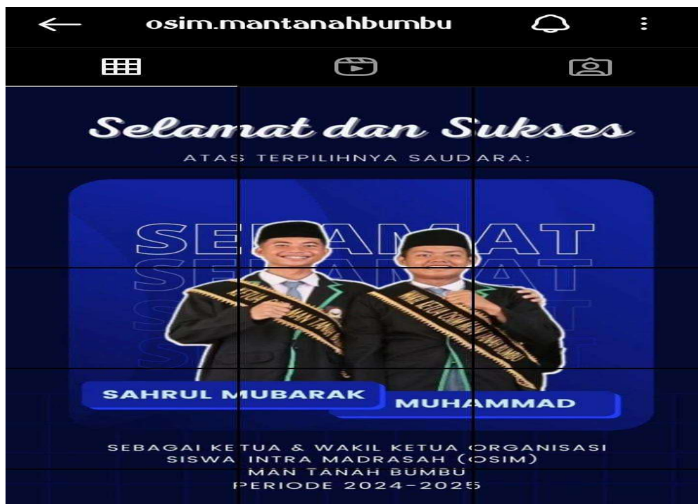
Gambar 2.16 Pemilihan OSIM MAN Tanah Bumbu