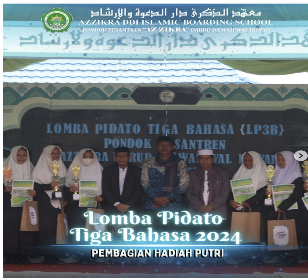
Gambar 2.24 Prestasi Siswa/Santri dalam Lomba Pidato Tiga Bahasa 2024