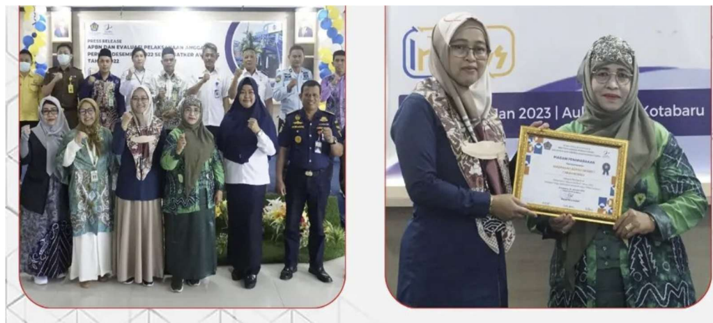
Gambar 2.17 Kepala MAN Tanah Bumbu Menerima Penghargaan dari KPPN sebagai Pengelola Keuangan Terbaik se-Wilayah Kerja KPPN Kotabaru