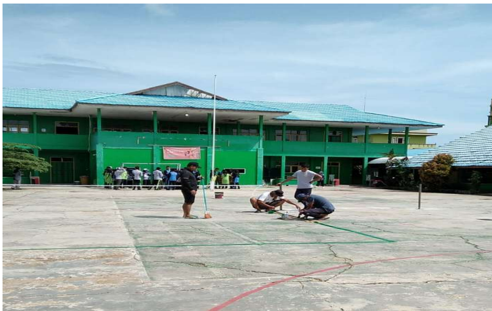
Gambar 2.15 Pemeliharaan Lapangan Olahraga MAN Tanah Bumbu