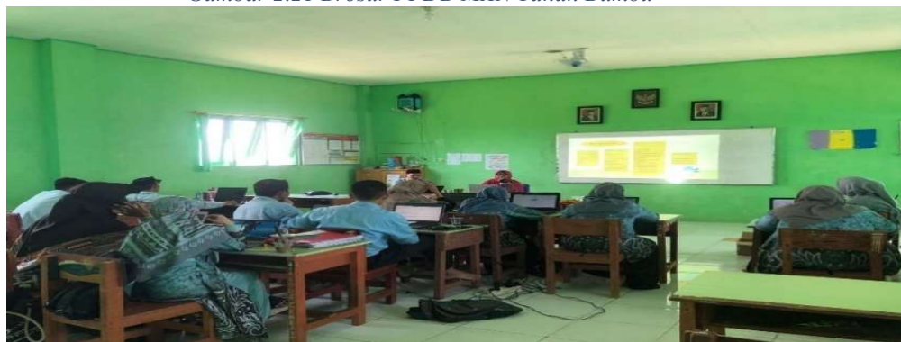
Gambar 2.22 Rapat Penyusunan Rencana Kerja Tahunan Madrasah (RKTm) MA Az Zikra Batulicin