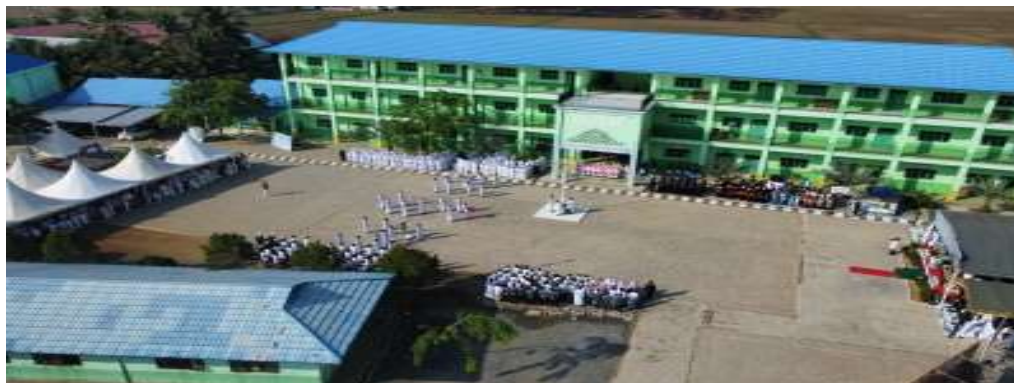
Gambar 2.23 Madrasah Aliyah Az Zikra Batulicin