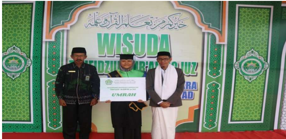
Gambar 2.25 Dokumentasi Siswa/Santri yang telah hafidzah 30 Juz