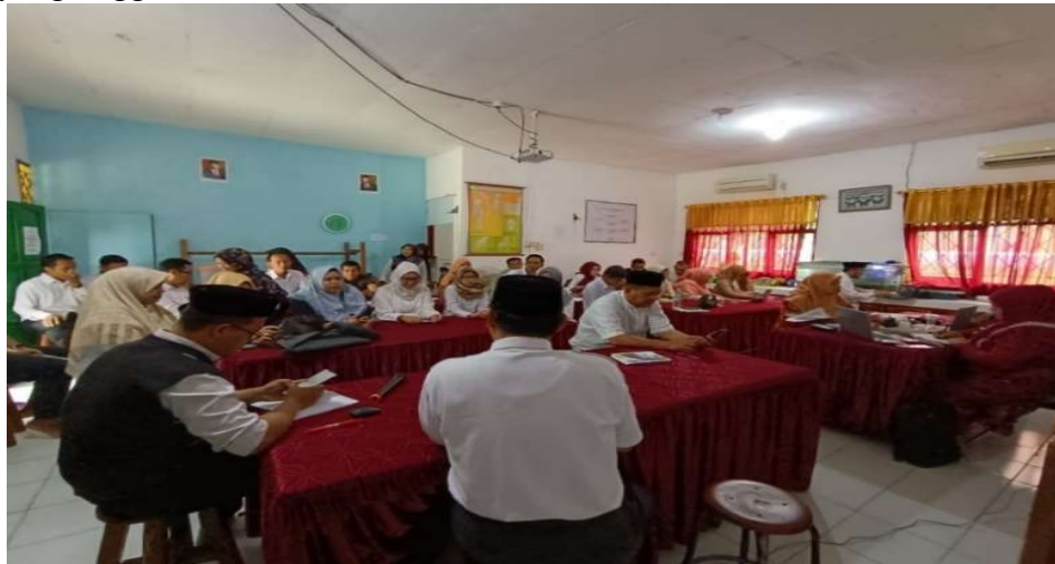
Gambar 2.9 Rapat Awal Tahun Penetapan Perencanaan

MAN Tanah Bumbu Sudah melaksanakan rencana strategis dengan analisis SWOT dan melibatkan berbagai unsur madrasah dalam merumuskan visi misi madrasah jangka Panjang yaitu Lembaga Pendidikan yang unggul.