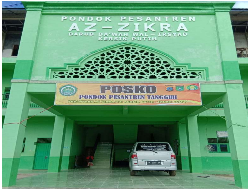
Gambar 2.6 Madrasah Aliyah Az Zikra Batulicin

Allah akan terus berkembang demi mencapai tujuan Pendidikan di Indonesia.