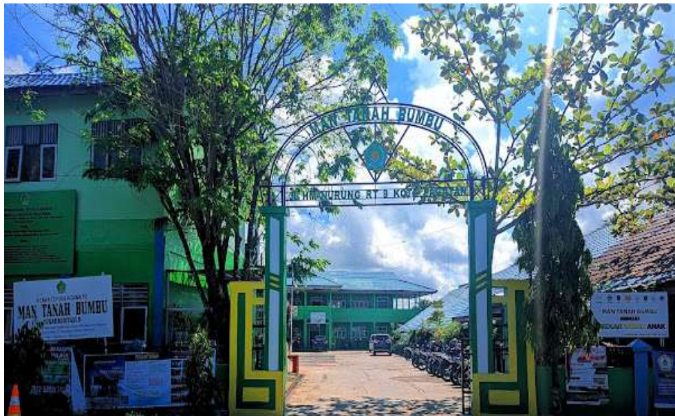
Gambar 2.4 Madrasah Aliyah Negeri Tanah Bumbu

Kehadiran Madrasah Aliyah Negeri Tanah Bumbu ini hingga sekarang, telah banyak memberikan kontribusi bagi dunia pendidikan khususnya pendidikan Agama bagi generasi penerus bangsa. Oleh Sebab