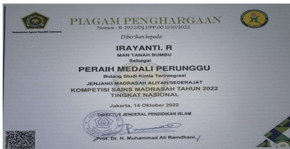
Gambar 2.10 Piagam Kejuaraan KSMNasional

Rapat perencanaan yang dilaksanakan di sekolah yang dihadiri guru dan perwakilan orang tua. Rapat yang dilaksanakan diawal tahun ini merumuskan visi dan misi jangka Panjang MAN Tanah Bumbu untuk membentuk Madrasah yang unggul. diantaranya melakukan pelatihan, mengoptimalkan teknologi dalam proses belajar mengajar dan menghasilkan peserta didik yang mampu menjuarai berbagai perlombaan contoh piagam penghargaan yang didapatkan pada Kompetisi sains.