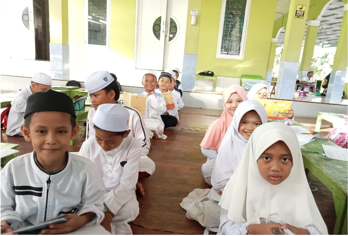
تقديم المفردات للأستاذ