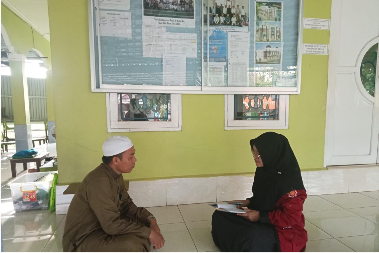
المقابلة مع مدير مدرسة القول الحق الدينية