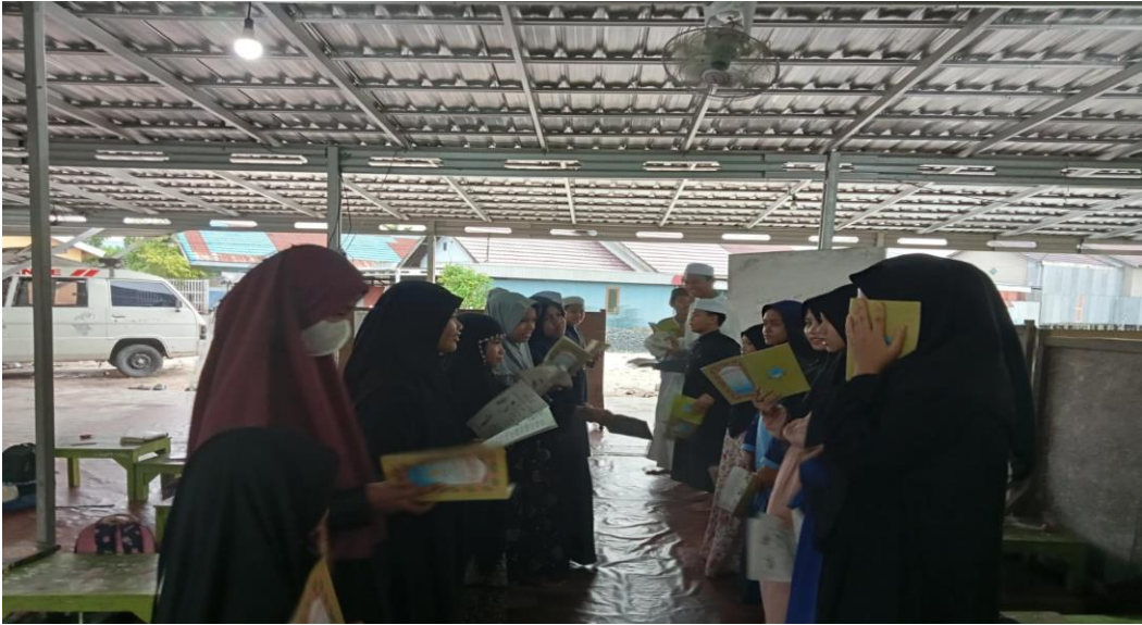
تدريب المحادثة في الفصل