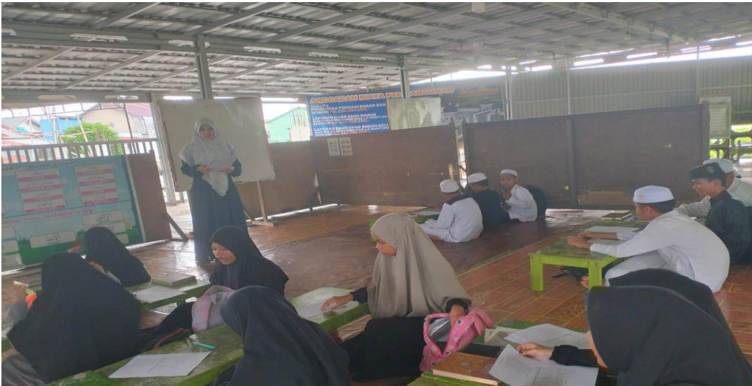
عملية تعليم اللغة العربية في مدرسة القول الحق الدينية