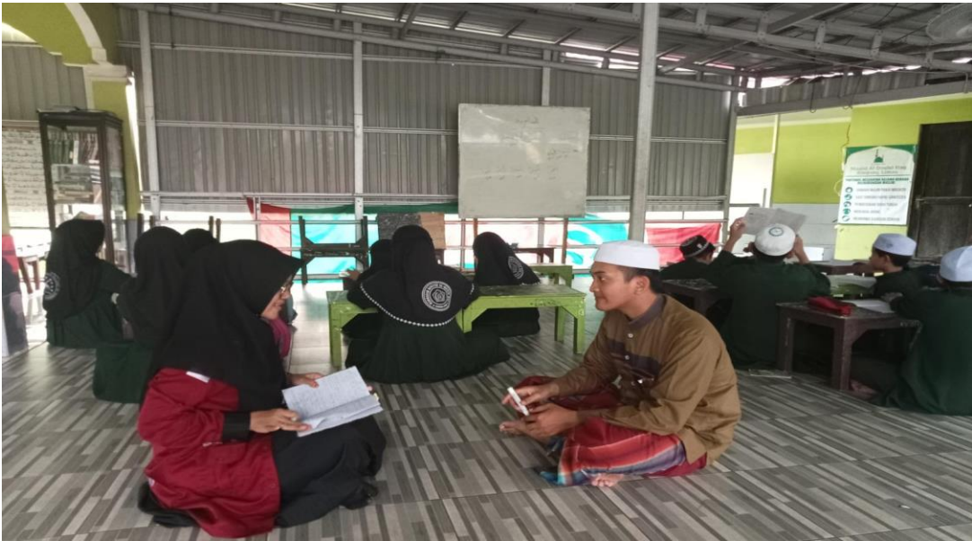
المقابلة مع أستاذ اللغة العربية مدرسة القول الحق الدينية