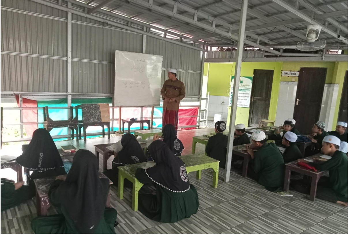
عملية تعليم اللغة العربية في مدرسة القول الحق الدينية