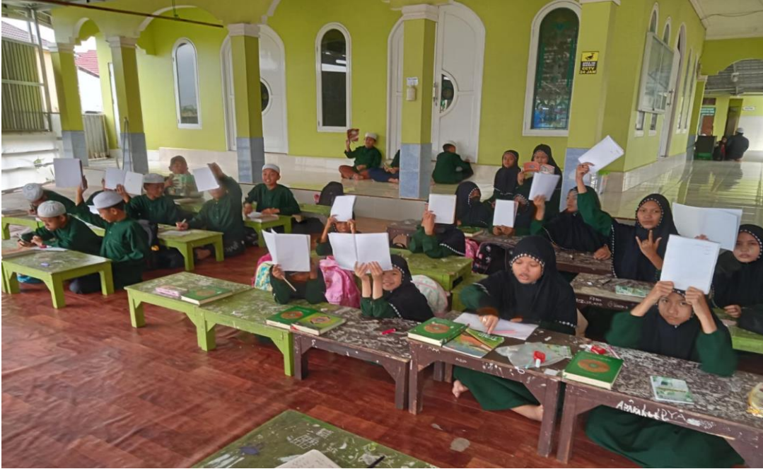
خمن المفردات باستخدام طريقة التصنيف الأول