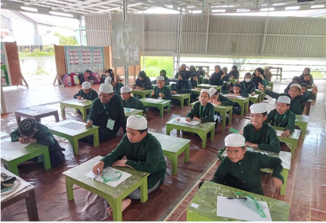
الاختبار التحريري لآخر السنة الدراسية