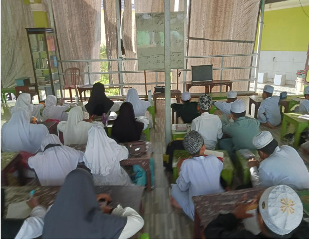
حفظ المفردات بشكل مستقل