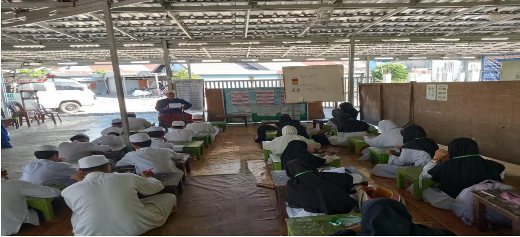
عملية تعليم الإملاء في الفصل