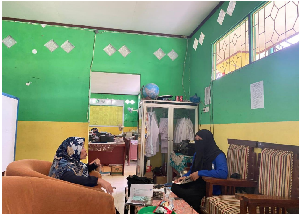
Wawancara dengan Kepala sekolah Madrasah Diniyah Takmiliah Tarbiyatul Islamiyah Kota Banjarmasin.