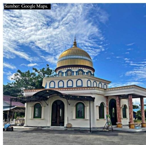
Makam Syekh Salman Al Farisi (Datu Gadung) dari luar.