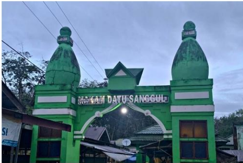
Makam Syekh Abdussomad Sirajul Huda (Datu Sanggul) dari luar.