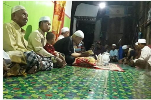
Pembacaan Manaqib Datu Batalas di salah satu rumah warga yang dibacakan oleh penulisnya sendiri.