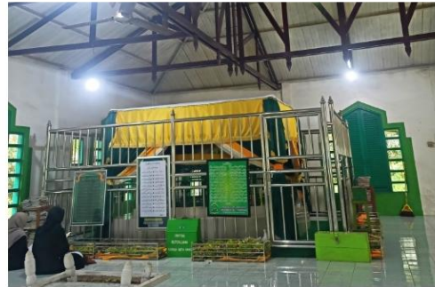
Makam Syekh Abdussomad Sirajul Huda (Datu Sanggul).