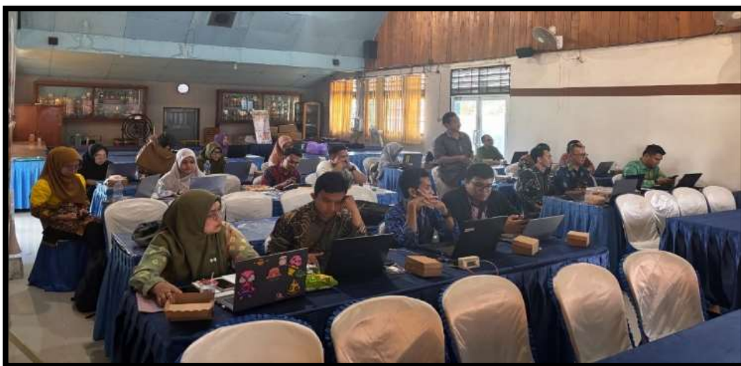
Gambar 4.7 Pelatihan Tenaga Kependidikan

Pelatihan khusus untuk kependidikan dapat membantu staf tata usaha meningkatkan kemampuan kerja, memberikan pelayanan yang lebih baik kepada siswa, guru, dan masyarakat. 130