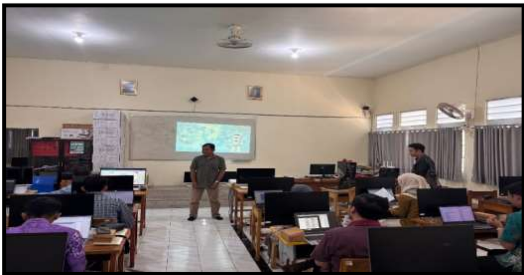
Gambar 4.5 Materi Kepegawaian dan Administrasi

Biasanya bergabung dengan guru, materinya tentang kepegawaian dan administrasi tata usaha. Pelatihan seperti itu biasanya diadakan oleh dinas, walaupun tidak terlalu sering. 122