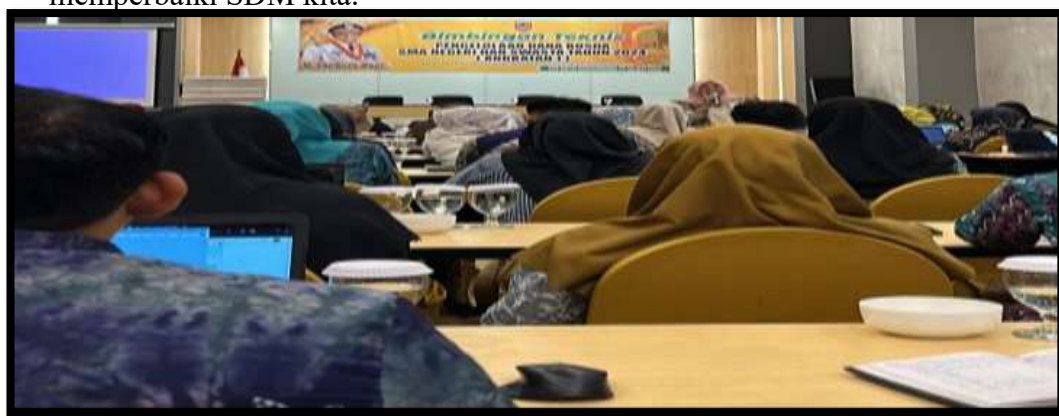
Gambar 4.2 Pengembangan SDM Kepegawaian

“Identifikasi kebutuhan pelatihan ya pertama ibu sebenarnya ibu tuh analisis situasi dulu melakukan analisis situasi untuk mengetahui kondisi saat ini dari tata usaha sekolah termasuk kelemahannya apa saja. Setelahnya ibu pengumpulan data termasuk survei, wawancara, analisis dokumen; yang keempat analisis data, penetapan prioritas, dan yang terakhir pengembangan rencana pelatihan. Jadi kita mengetahui kekurangan kita di mana untuk memperbaiki SDM kita.” 104