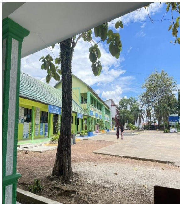
مباني معهد دار الهجرة للبنات