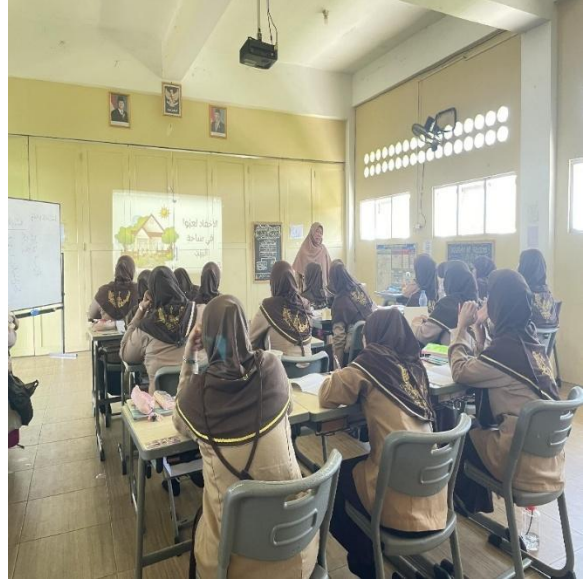
أنشطة تعليم اللغة العربية