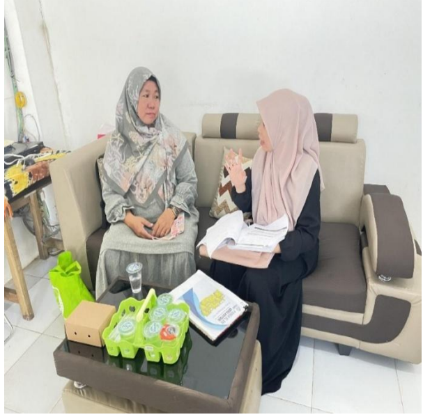
مقابلة مع المعلّمة والطالبات بمعهد دار الهجرة للبنات